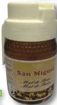
Mel SAN MIGUEL dosificador 500 Gr