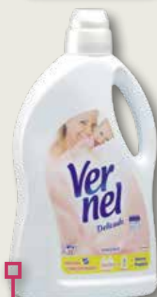
Suavitant delicat VERNEL 36 rentats