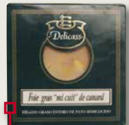
Foie Mi Cuit DELICASS 40 Gr