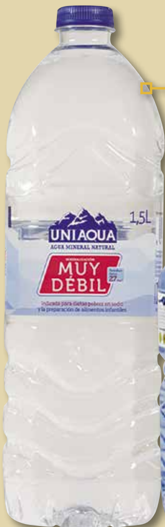
Aigua UNIAQUA pet 1500 Cl