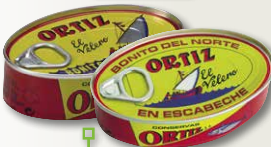
Bonítol en oli d'oliva o escabetx ORTIZ 1/4