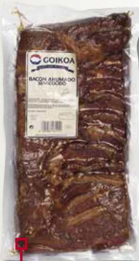
Bacó fumat GOIKOA el Kg