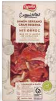
Pernil serrà Duroc ESPUÑA Exquisitas 80 Gr