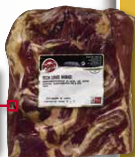
Bacó curat fumat PONT el Kg