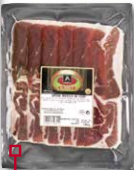
Pernil ibèric de cebo MAFRESA 80 Gr