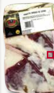
Cansalada ibèrica saladada CAMPODULCE el Kg