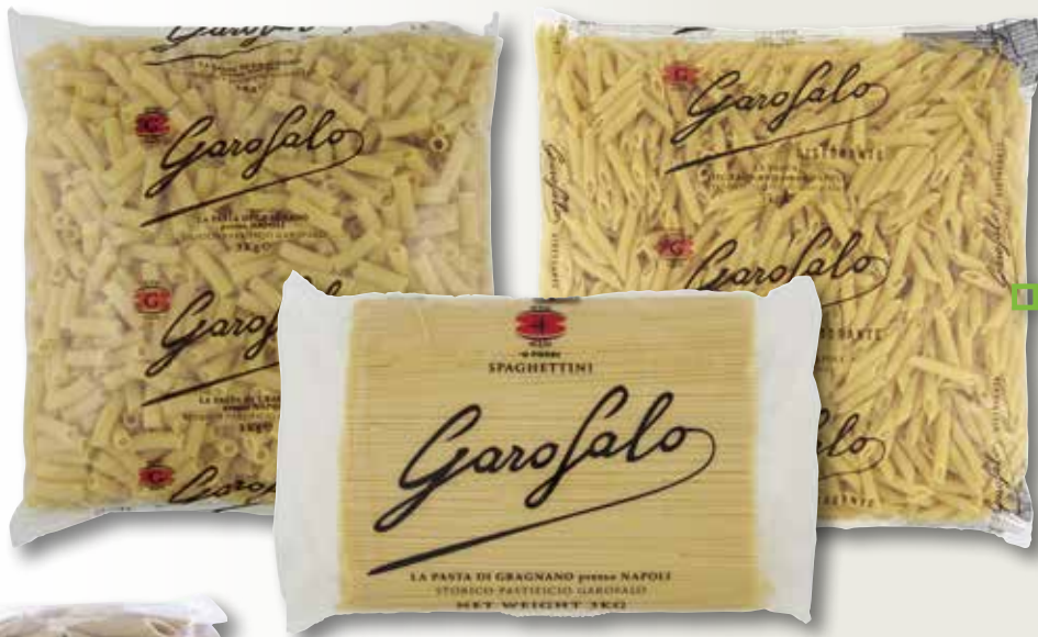
Spaghettini, Elicoidale o Penne ziti rigate GAROFALO 3 Kg