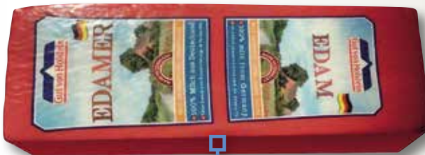
Formatge barra edam 40% NEUTRO el Kg