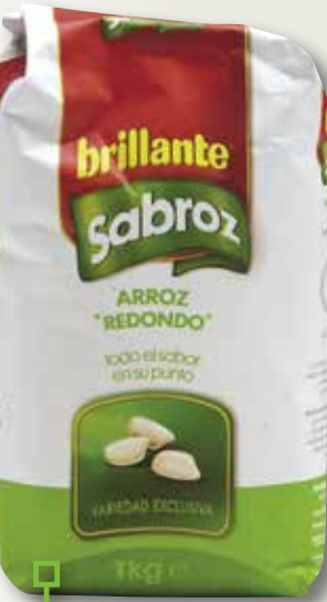
Arròs BRILLANTE Sabroz 1 Kg