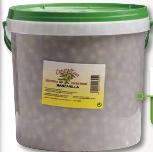
Oliva manzanilla CAMPO OLIVAR 10 Kg