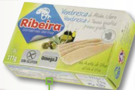
Ventresca de tonyina clara RIBEIRA OL-120