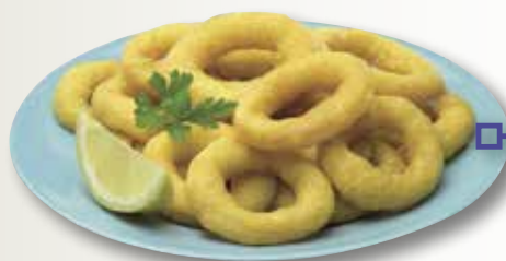
Anella casolana MAHESO 1 Kg