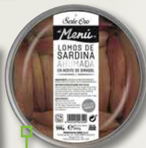
Sardina fumada EL MENU 550 Gr