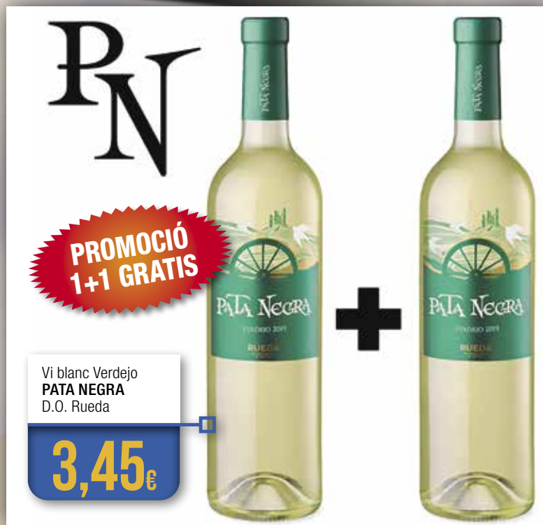
Vi blanc Verdejo PATA NEGRA D.O. Rueda