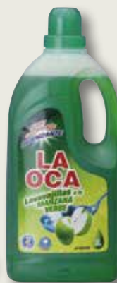
Rentavaixelles LA OCA poma verda 3 L