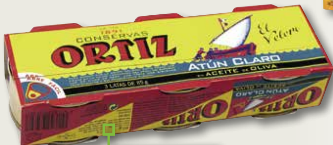
Tonyina clara en oli d'oliva ORTIZ RO-100 pack 3, la unitat