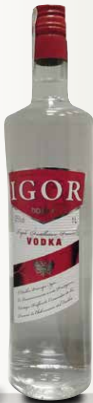
Vodka IGOR 1 L