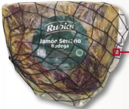
Centre de pernil serrà Bodega RUBIA 1/2 peça el Kg