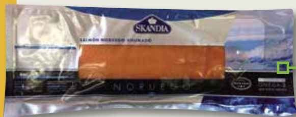
Salmó fumat pretallat SKANDIA 700 Gr