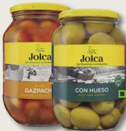
Oliva verdial gaspatxa partida o gordal amb òs JOLCA 850 Gr