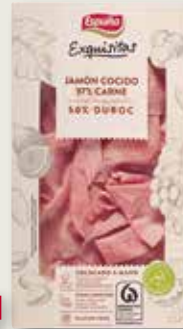
Pernil curat Duroc ESPUÑA Exquisitas 80 Gr