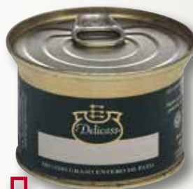
Foie d'ànec sencer DELICASS llauna 130 Gr