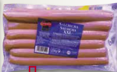
Salsitxes Hot Dog CAMPOFRIO