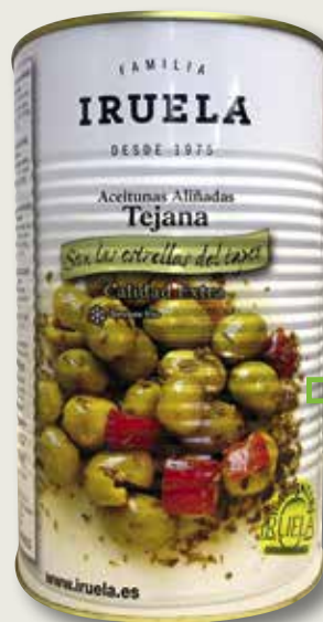
Oliva texana IRUELA llauna 5 Kg