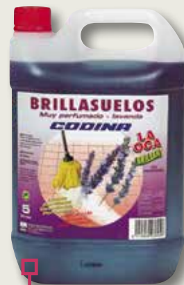
Brillaterres CODINA lavanda 5 L