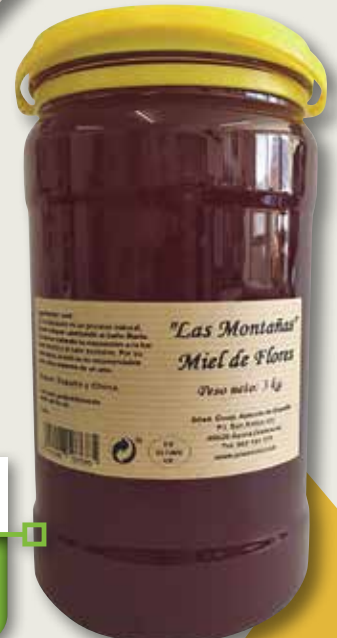
Mel miiflors ANAE cubell 3 Kg