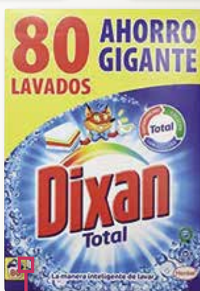
Detergent DIXAN 80 potets