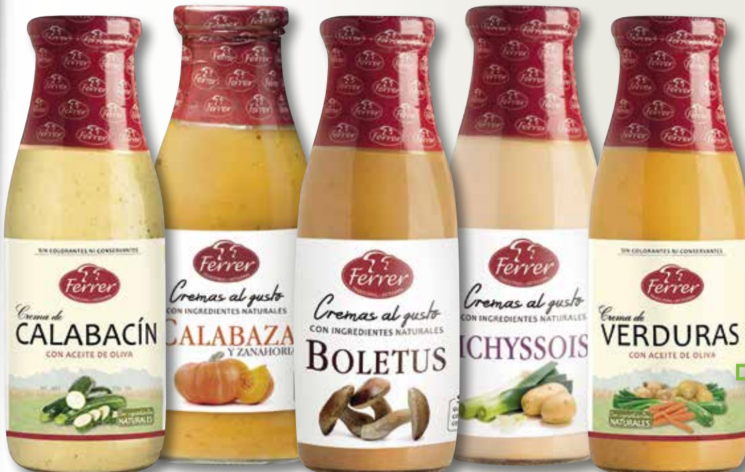
Cremes de verdures FERRER 485 MI