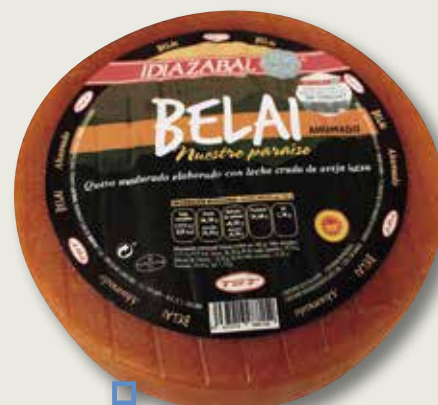
Formatge Idiazabal fumat D.O. BELAI el Kg