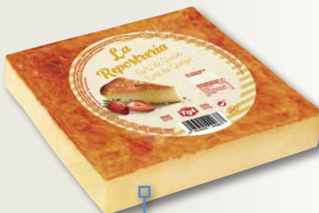
Pastis de formatge TIO RESTI 1600 Gr