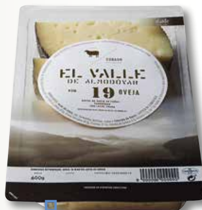
Formatge artesà d'ovella EL VALLE mini tascó 600 Gr