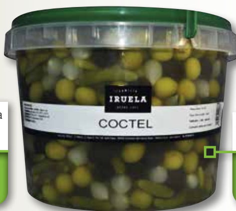
Cocktail IRUELA cub 5 Kg