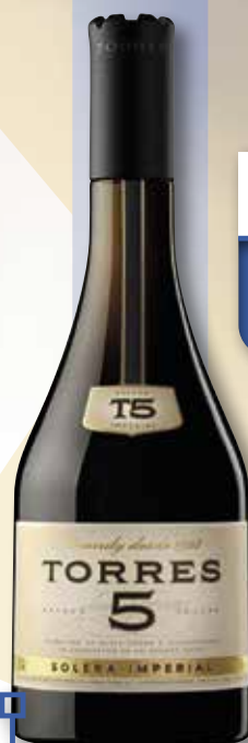
Brandy TORRES 5 anys 70 Cl