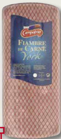
Fiambre CAMPOFRIO el Kg