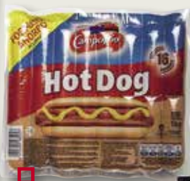
Salsitxes Hot Dog CAMPOFRIO New Yorker