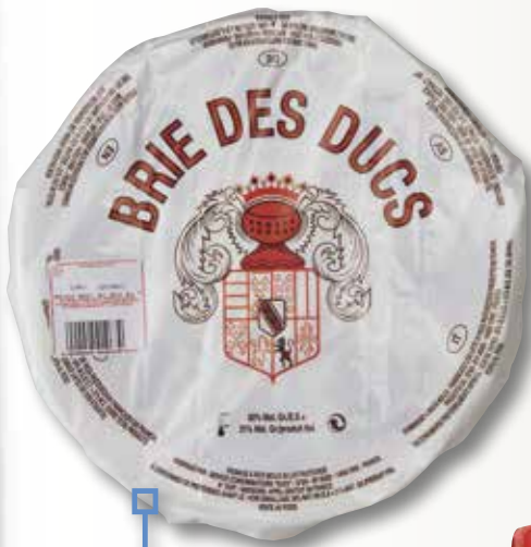
Formatge brie DES DUCS el Kg