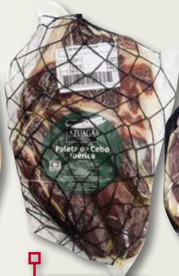
Centre d'espalla ibèrica de cebo AZUAGA el Kg