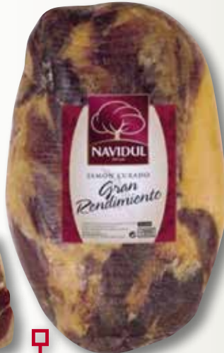
Centre de pernil curat G/R NAVIDUL el Kg