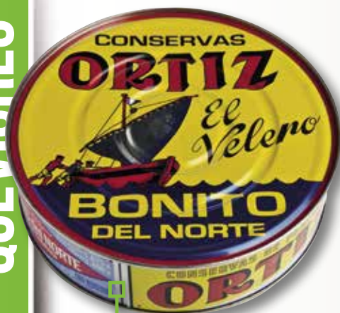
Bonítol en escabetx ORTIZ RO-1800