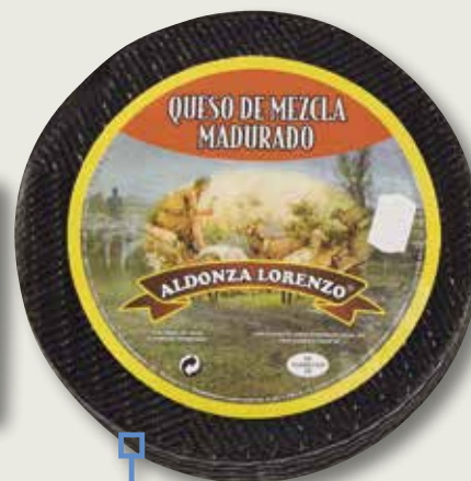
Formatge semicurat negre ALDONZA el Kg