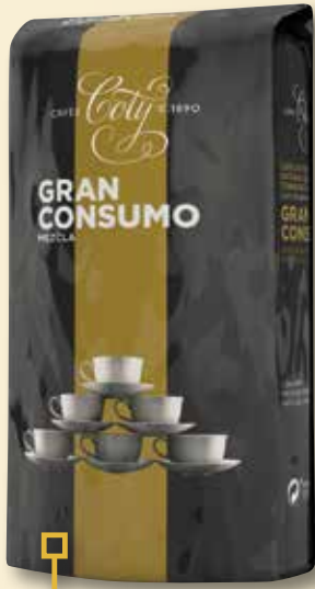
Cafè en gra mescla COTY 1 Kg