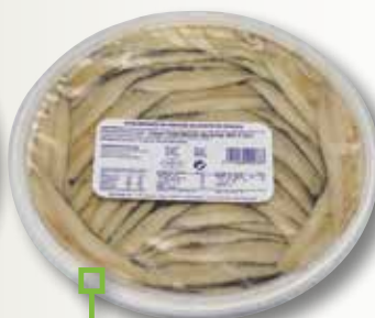
Seitó en oli/vinagre NASSARI 500 Gr