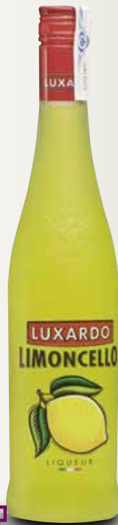
Limoncello LUXARDO 70 Cl