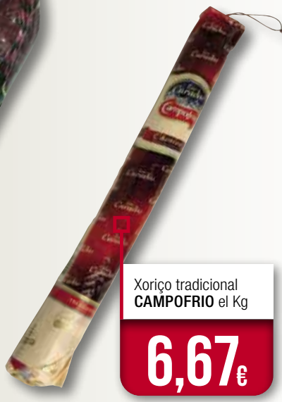
Xoriço tradicional CAMPOFRIO el Kg