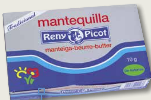
Mantega RENY PICOT 10 Gr 150 unitats