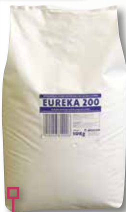
Detergent EUREKA sac 10 Kg