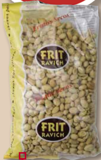
Cacauet repelat salat FRIT RAVICH 1 Kg