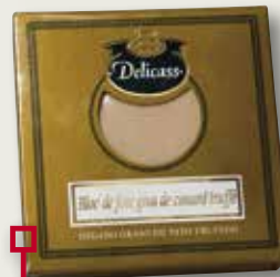
Ànec trufat DELICASS 40 Gr