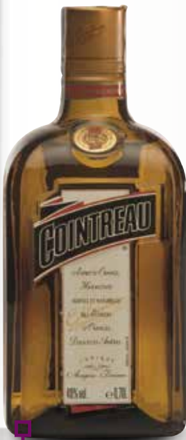
COINTREAU 70 Cl