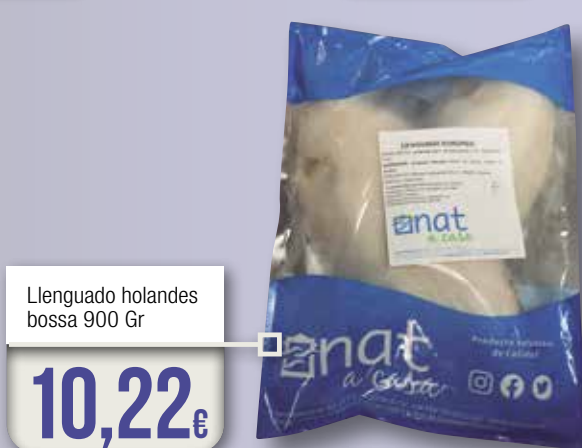
Lenguado holandés bossa 900 Gr