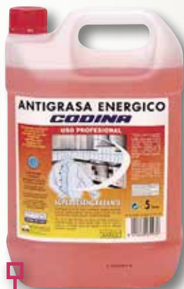
Antigreix Energic CODINA 5 L