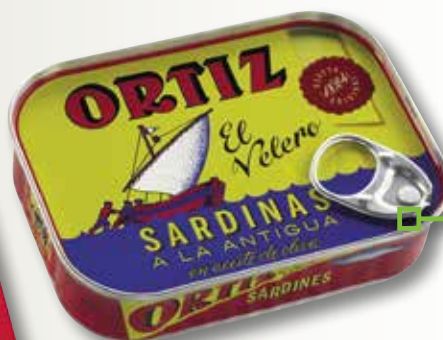
Sardines a l'antiga en oli d'oliva ORTIZ RR-150