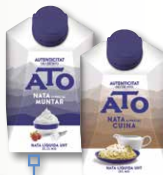
Nata per muntar o cuinar ATO 200 MI