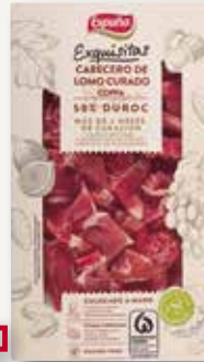
Cap de llom Duroc ESPUÑA Exquisitas 80 Gr