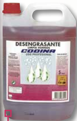
Desengreixant forns CODINA 5 L