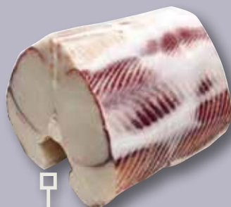
Llom de caella 2/2 kg aprox.