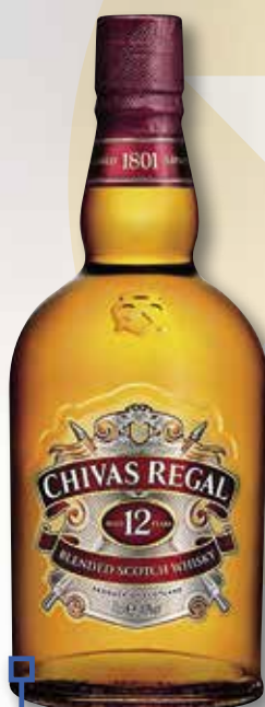
Whisky escocès CHIVAS 12 anys 70 Cl