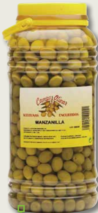
Oliva manzanilla CAMPO OLIVAR 3 Kg