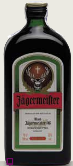
JAGERMEISTER 70 Cl