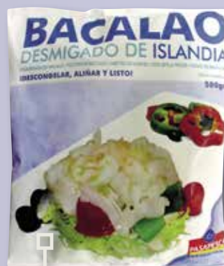
Bacallà esqueixat bossa 500 Gr