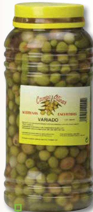
Oliva variada CAMPO OLIVAR 3 Kg