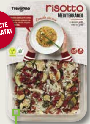
Risotto mediterrani TREVIJANO 280 Gr