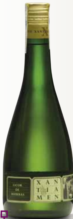
Licor d'herbes XANTIAMEN 70 Cl