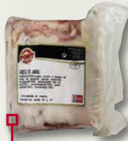
Cap de senglar PONT el Kg