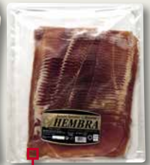
Pernil serrà Gran Reserva HEMBRA 500 Gr