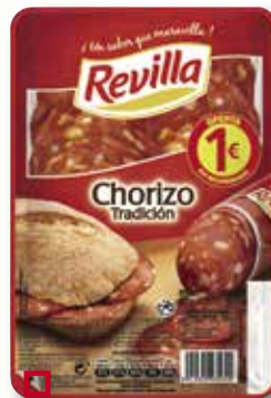
Xoriço tradicional REVILLA 100 Gr