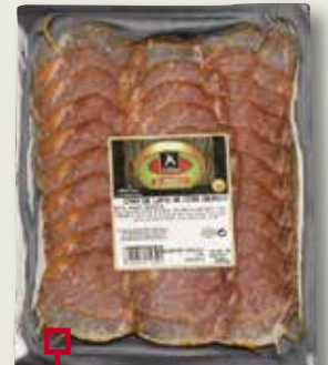
Llom ibèric de cebo MAFRESA 80 Gr