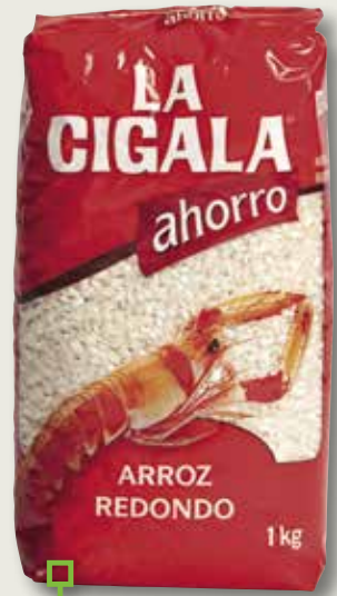
Arròs rodó LA CIGALA 1 Kg