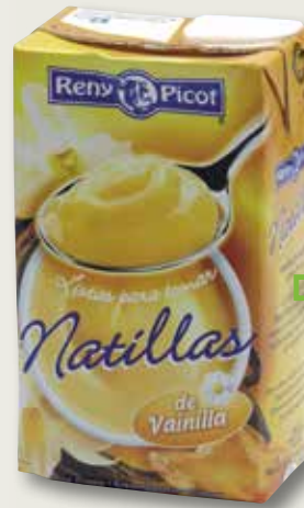
Natilles líquides RENY PICOT brik 1 L