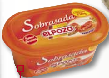
Sobrasada EL POZO terrina 250 Gr