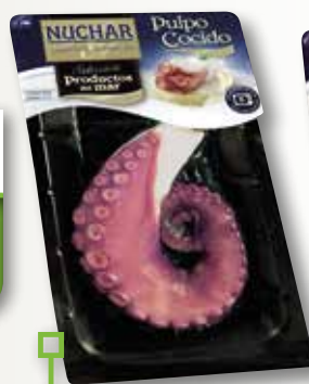
Pop cuit NUCHAR 1 pota 150 Gr