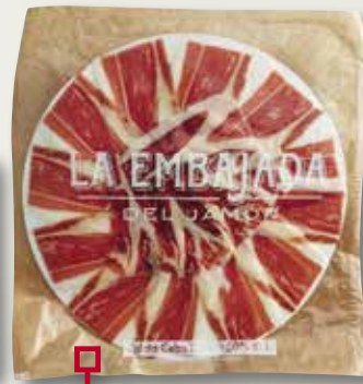
Espatlla cebo emplatada LA EMBAJADA 100 Gr