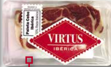
Espatlla de gla VIRTUS hostaleria 250 Gr