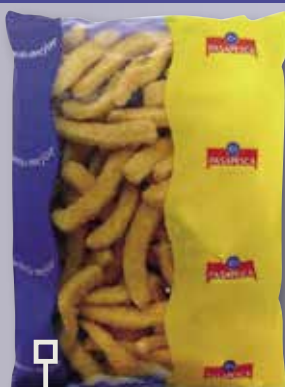
Rabes empanades bossa 1 Kg