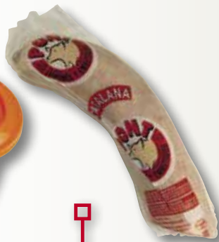
Catalana extra PONT el Kg