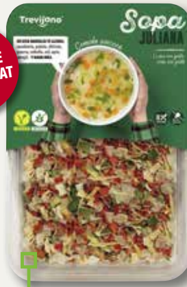
Sopa Juliana TREVIJANO 100 Gr