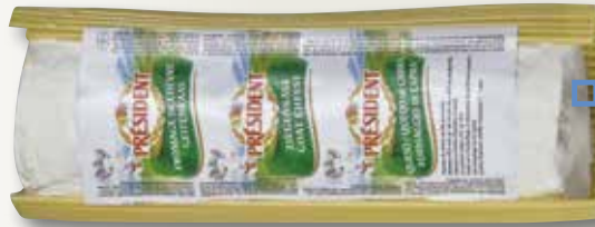
Formatge de cabra RIBLAIRE el Kg