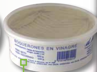
Seitó en tarrina EL MENU 850 Gr