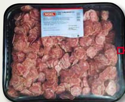
Fuet NOEL 500 Gr