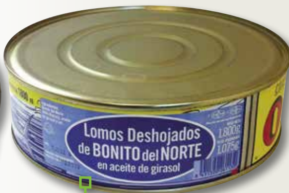
Llom desfullat de bonítol ORTIZ RO-1800