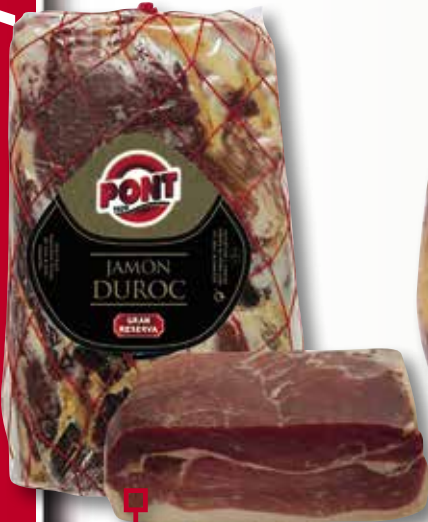
Pernil Duroc PONT block 1/2 peça el Kg