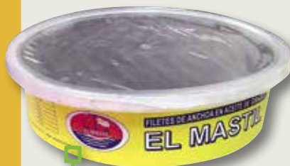
Anxova EL MASTIL 100 filets