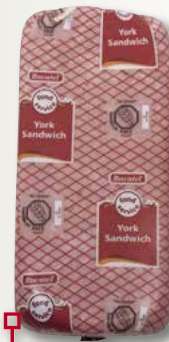
York sandvitx BOCATELL 11x11 el Kg