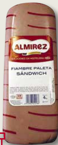
Sandvitx ALMIREZ 4 Kg