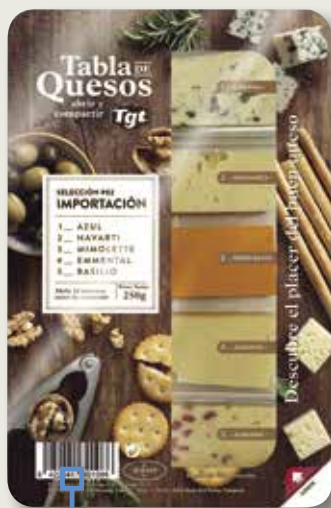
Taula Import LAFUENTE 250 Gr