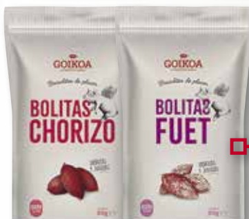
Bolites xoriço o fuet GOIKOIA 50 Gr