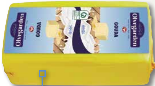
Formatge barra gouda OLVEGARDEN el Kg