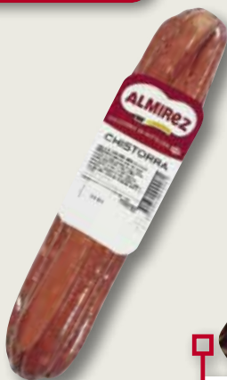
Xistorra ALMIREZ 1 Kg