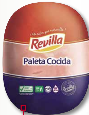
Espatlla cuita REVILLA el Kg