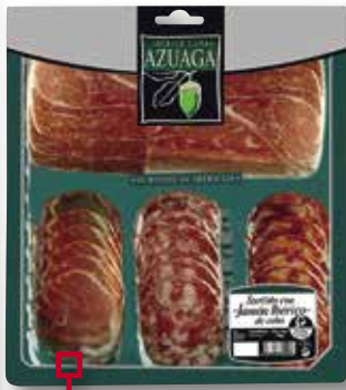
Assortiment de ibèrics AZUAGA 140 Gr