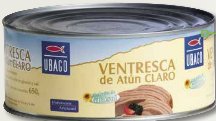
Ventresca de tonyina clara UBAGO RO-1000