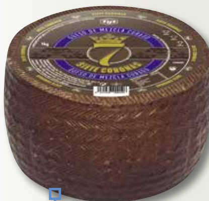
Formatge curat 7 CORONAS el Kg