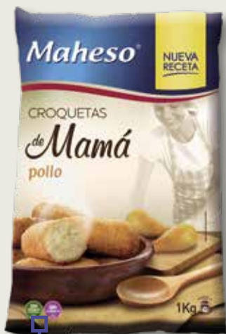
Croquetes de Mamá de pollastre MAHESO 1 Kg