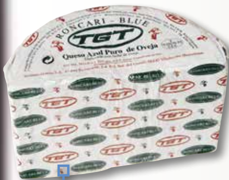
Formatge blue RONKARI el Kg