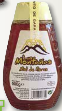
Mel miiflors LAS MONTAÑAS antigoteig 500 Gr