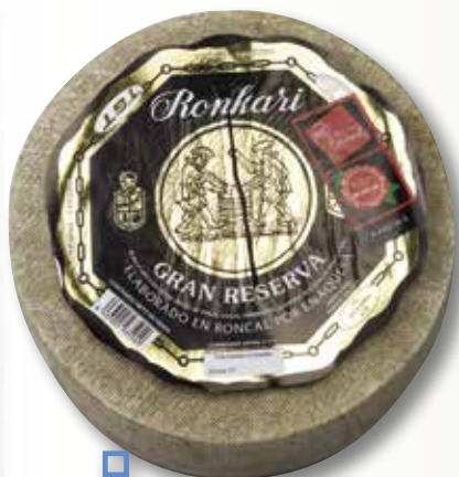
Formatge RONKARI D.O. Gran Reserva el Kg