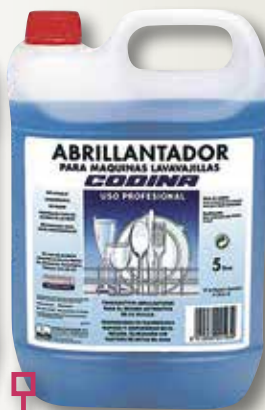
Abrillantador rentavaixelles CODINA 5 L