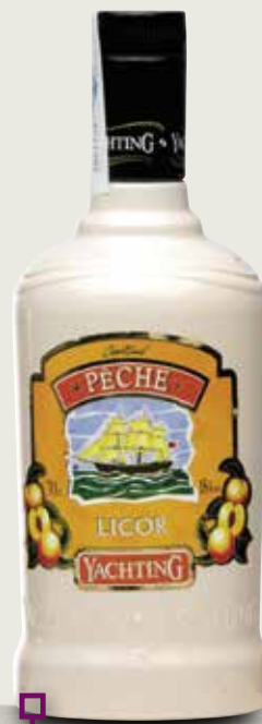
Licor de whisky- préssec YACHTING