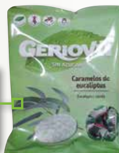
Caramel mini eucaliptus GERIO 75 Gr