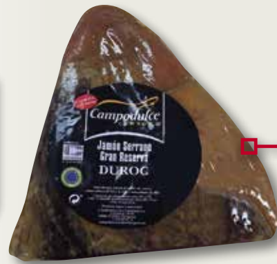
Centre de pernil serrà Gran Reserva Duroc CAMPODULCE el Kg