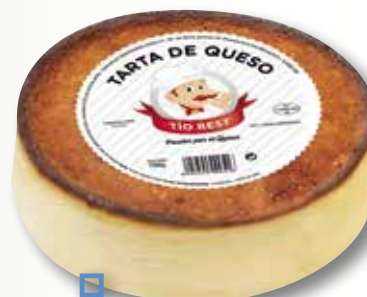
Tarta formatge TIO RESTI individual