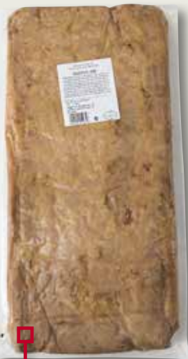
Bacó motllo B CAMPOFRIO el Kg