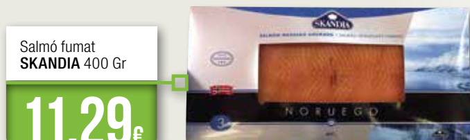
Salmó fumat SKANDIA 400 Gr