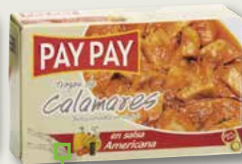
Calamars en salsa americana PAY PAY OL-120