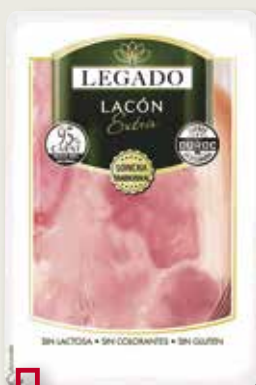
Lacon extra LEGADO 180 Gr