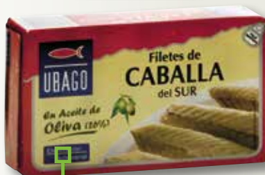
Verat del sud en oli d'oliva UBAGO RR-125