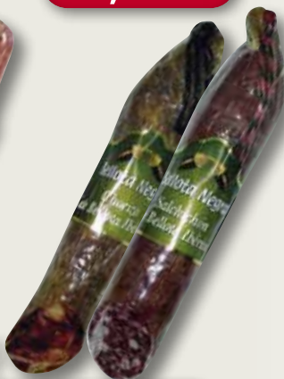
Llonganissa o xoriço ibèric de gla BELLOTA NEGRA ek Kg