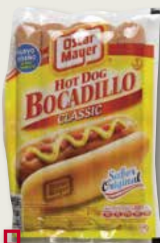
Frankfurt OSCAR MAYER Bocadillo 5 unitats