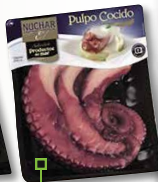
Pota de pop NUCHAR 500 Gr 3 ó 4 unitats