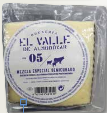
Formatge mescla semi EL VALLE 05 1/4 el Kg