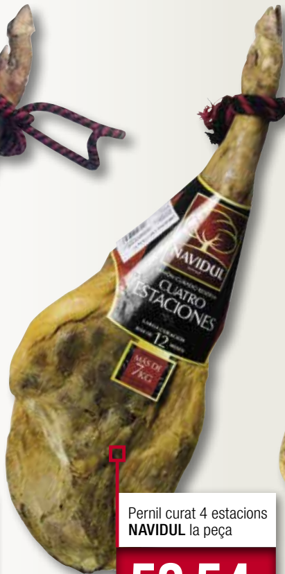
Pernil curat 4 estacions NAVIDUL la peça