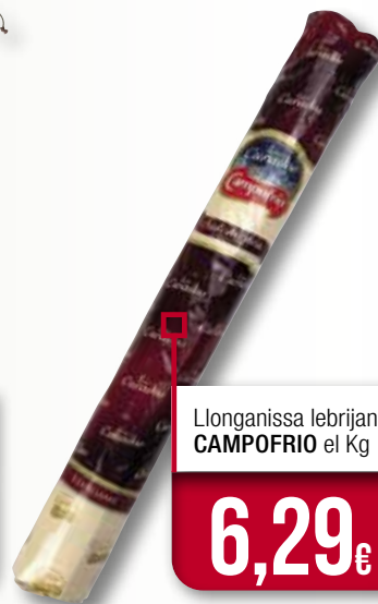
Llonganissa lebrijana CAMPOFRIO el Kg