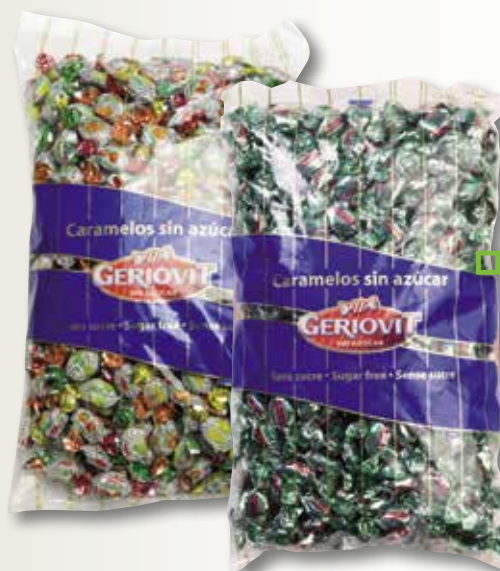
Caramel mini sucs o eucaliptus GERIOVIT 1 Kg