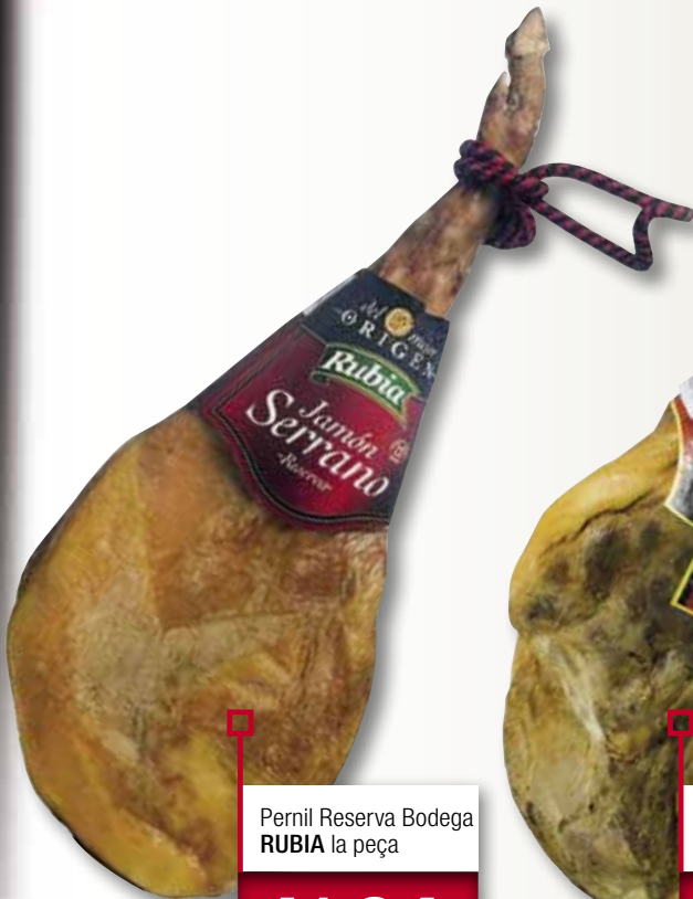
Pernil Reserva Bodega RUBIA la peça