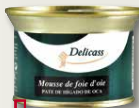
Mousse d'oca DELICASS llauna 130 Gr