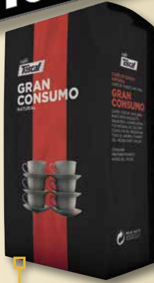
Cafè en gra natural TOSCAF 1 Kg