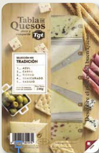
Taula mixta LAFUENTE 240 Gr