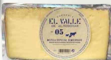
Formatge mescla semi EL VALLE 05 1/2 peça el Kg