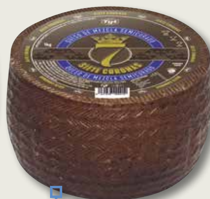
Formatge semi 7 CORONAS el Kg