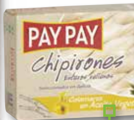
Xipirons farcits en oli o salsa americana PAY PAY OL-120