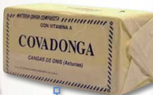
Mantega COVADONGA el Kg