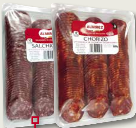
Llonganissa o xoriço All Natural ALMIREZ 500 Gr