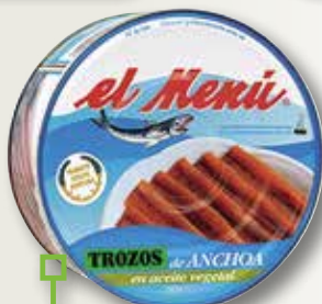
Trossos anxova EL MENU RO-1000