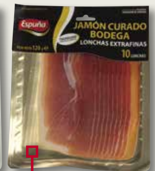
Pernil curat extrafi ESPUÑA 120 Gr