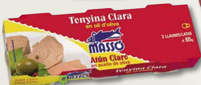
Tonyina clara en oli d'oliva MASSO RO-70 pack 3, la unitat