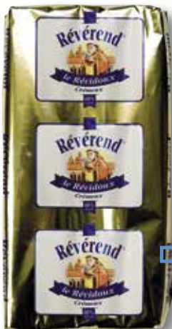
Formatge brie en barra LE REVIDOUX el Kg