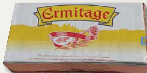
Formatge brie rectangular ERMITAGE el Kg