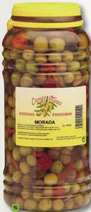
Oliva morada CAMPO OLIVAR 3 Kg