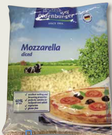
Formatge mozzarella a daus OLDENBURGER 2 Kg