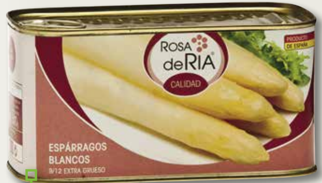
Espàrrecs blancs ROSA RIA 9/12 1 Kg