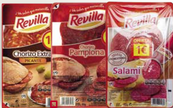
Xoriço picant, Pamplona o salami REVILLA 85 Gr