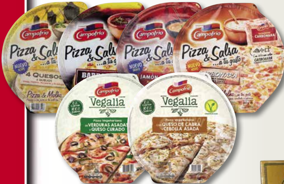
Pizza CAMPOFRIO 4 formatges, Barbacoa, pernil-formatge, carbonara & salsa, Vegalia de verdures rostides amb formatge o Vegalia formatge cabra/ceba