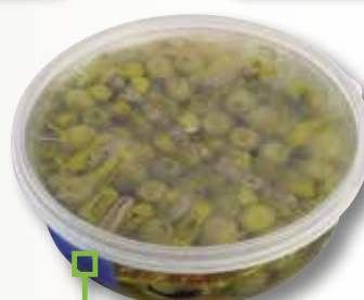
Bandereta Gilda EL MENU 850 Gr