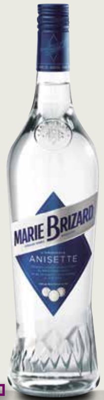
Anisette MARIE BRIZARD 1 L