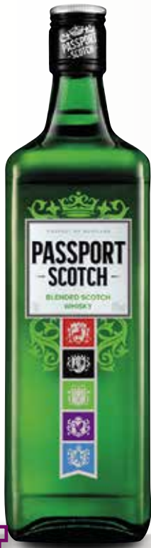
Whisky escocès PASSPORT 70 Cl