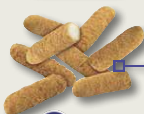
Varettes de pollastre MAHESO 1 Kg