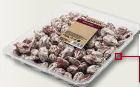
Mini fuet GOIKOIA 500 Gr