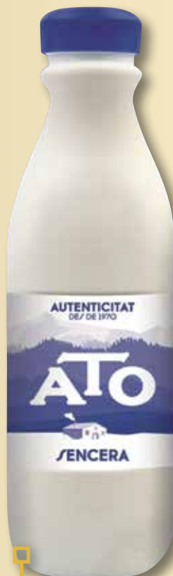
Llet sencera ATO 1,5 L