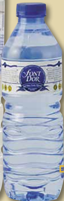
Aigua mineral FONTDOR pet 50 Cl