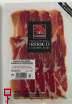
Pernil de cebo NAVIDUL 110 Gr