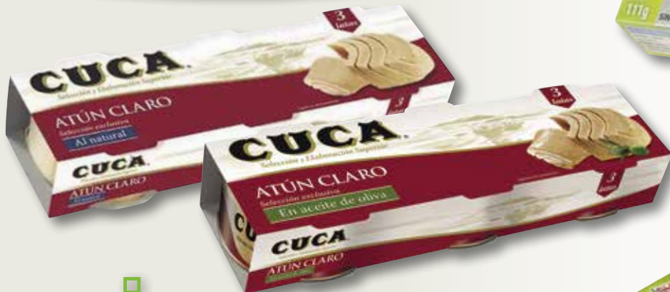
Tonyina clara al natural o en oli d'oliva CUCA RO-70 pack 3, la unitat