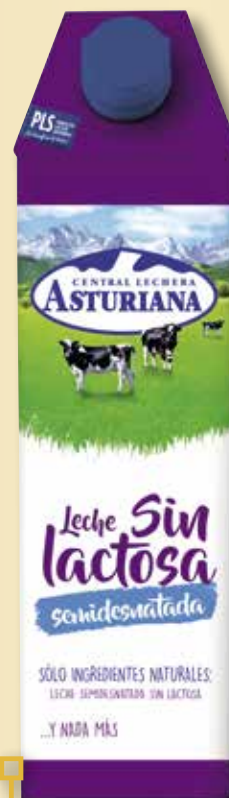
Llet sense lactosa amb calci ASTURIANA 1 L