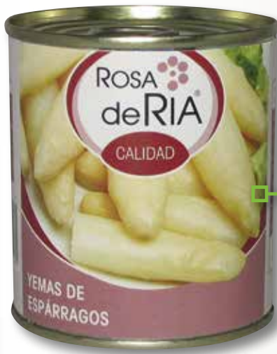
limes cilindre 1 a ROSA RIA 1/3