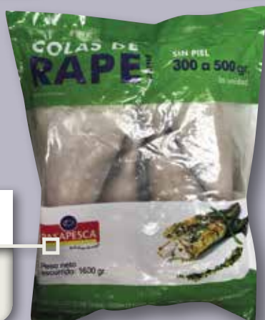
Cua de rap 300/500 bossa 1600 Gr