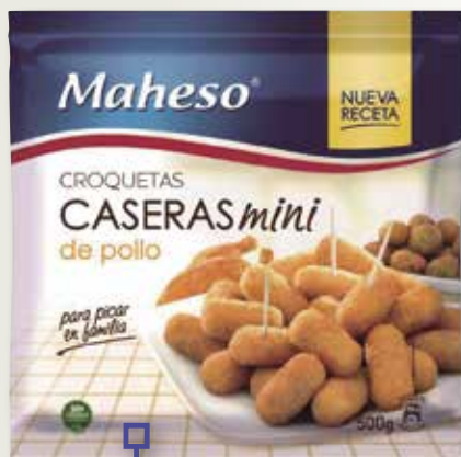
Minicroqueta MAHESO 500 Gr