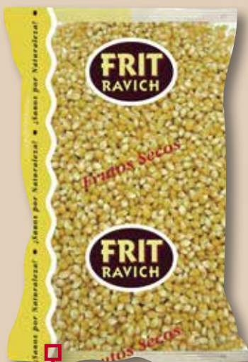
Crispetes de blat de moro FRIT RAVICH 1 kg