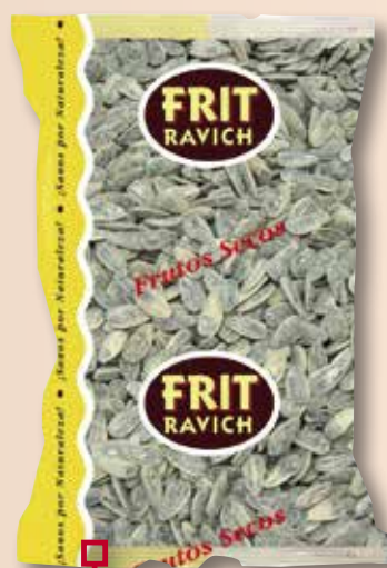
Pipa amb sal FRIT RAVICH 1 Kg