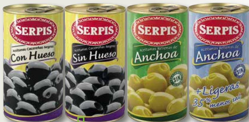
Oliva perla amb o sense pinyol, farcida d'anxova o més lleugera SERPIS 350 Gr