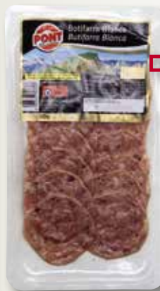
Botifarra blanca PONT 90 Gr