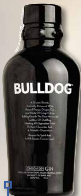
Gin Premium BULLDOG 70 Cl