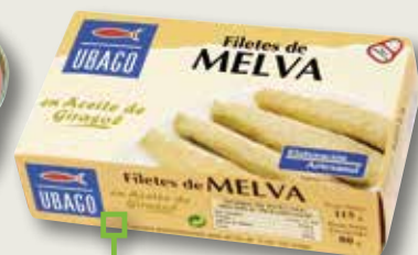
Melva en oli de girasol UBAGO RR-125