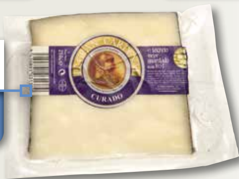
Formatge llet crua GRAN CARDENAL tascó 250 Gr