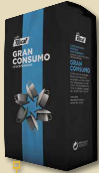
Cafè en gra descafeïnat TOSCAF gran consum 1 Kg