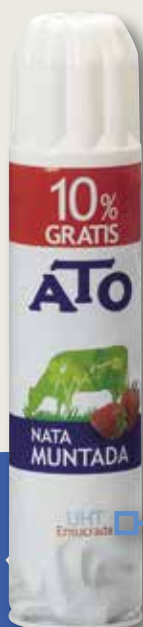
Nata ATO spray 250 MI