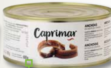
Anxova en oli vegetal CAPRIMAR RO-1000