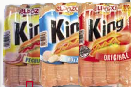
Sasitxes EL POZO King gall dindi, mozzarella o original 330 Gr