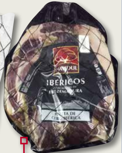
Centre d'espalla ibèrica NAVIDUL BILBAO el Kg