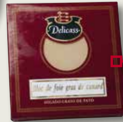
Fetge d'ànec DELICASS 40 Gr