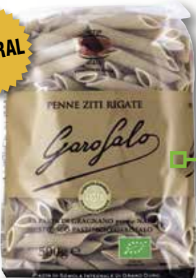
Spaghetti o Penne rigate integral GAROFALO 500 Gr