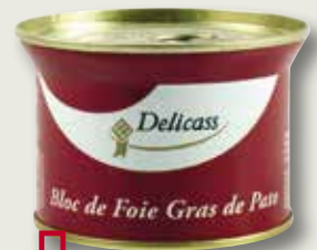
Bloc de foie d'ànec DELICASS 130 Gr