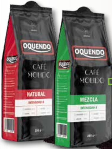
Cafè molt natural o mescla OQUENDO 250 Gr