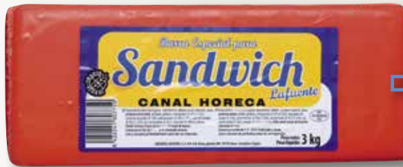
Formatge barra Sandvitx HORECA peça 3 Kg