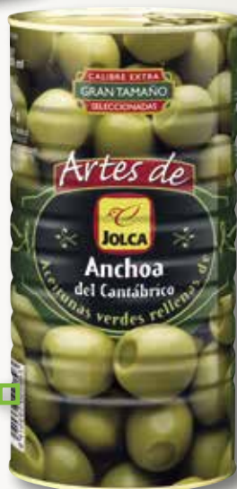
Oliva farcida amb anxova del cantàbric ARTES DE JOLCA 160/200 2 Kg