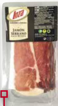
Pernil 100% Duroc LOZA 500 Gr