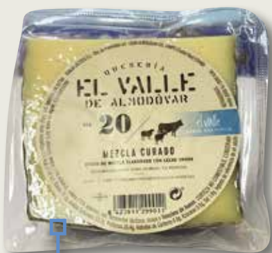
Formatge mescla curat EL VALLE 20 1/4 el Kg