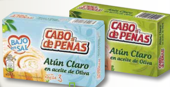
Tonyina en oli d'oliva normal o baix en sal CABO DE PEÑAS OL-120