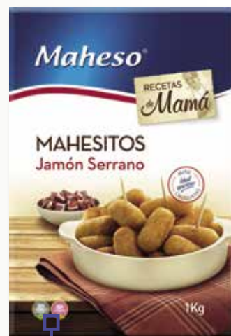
Mahesitos de pernil MAHESO 1 Kg