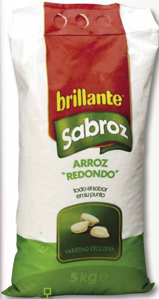
Arròs BRILLANTE Sabroz 5 Kg