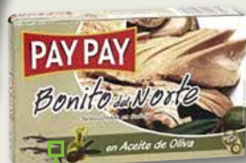
Bonítol en oli d'oliva PAY PAY OL-120