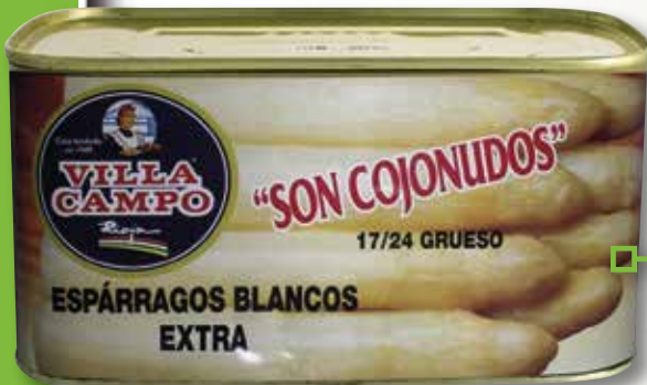
Espàrrecs blancs extra VILLACAMPO 17/24 1 Kg