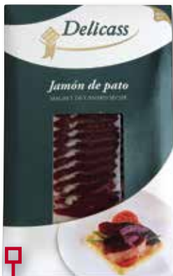
Pernil d'ànec DELICASS 50 Gr