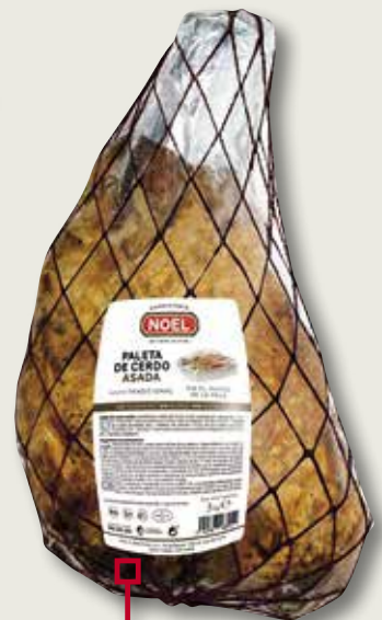
Espatlla rostida NOEL peça