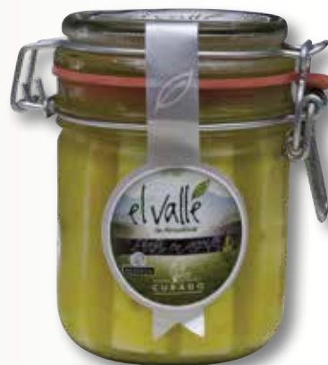
Formatge en oli EL VALLE PLATA pot 400 Gr