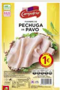
Pit de gall dindi extrasucòs CAMPOFRIO 100 Gr