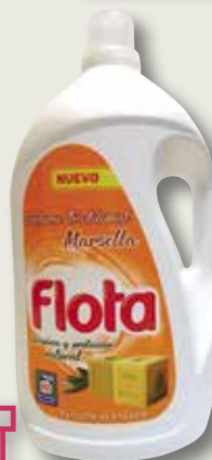
Detergent gel FLOTA Marsella 90 rentats