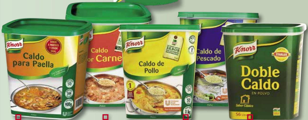
Brou de paella KNORR 900 Gr