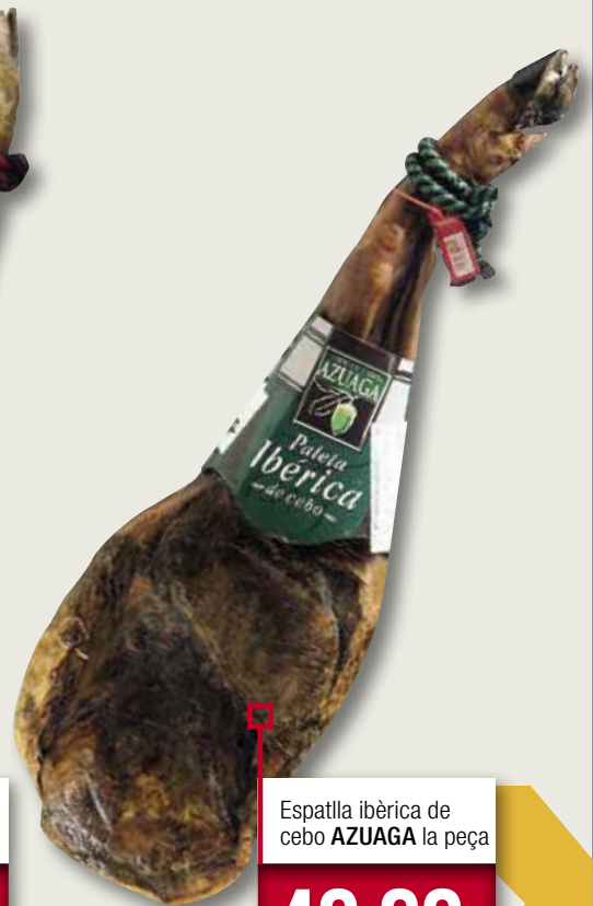
Espalla ibèrica de cebo AZUAGA la peça