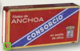
Anxova en oli d'oliva CONSORCIO 1/8