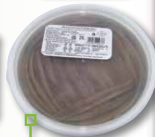
Anxova del cantàbric NASSARI 50 filets