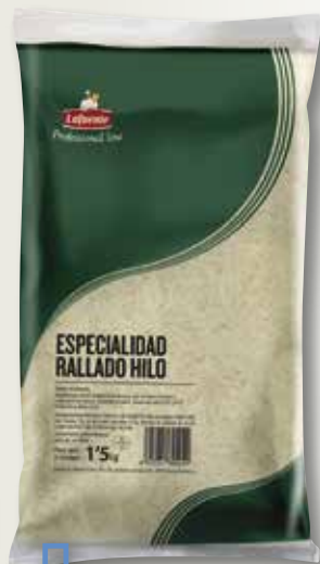
Formatge ratllat per gratinar HORECA 1'5 Kg