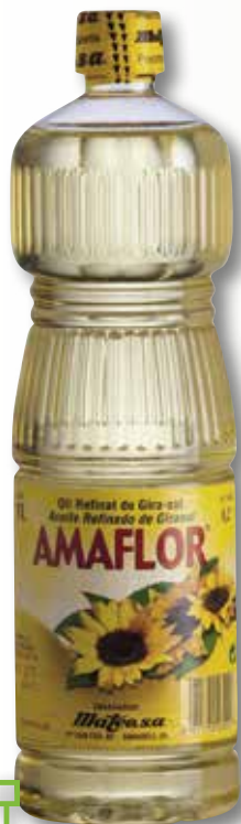
Oli de gira-sol AMAFLOR 1 L