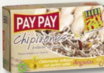
Xipirons farcits d'angula PAY PAY OL-120