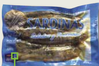
Sardines prensades UBAGO 4 unitats