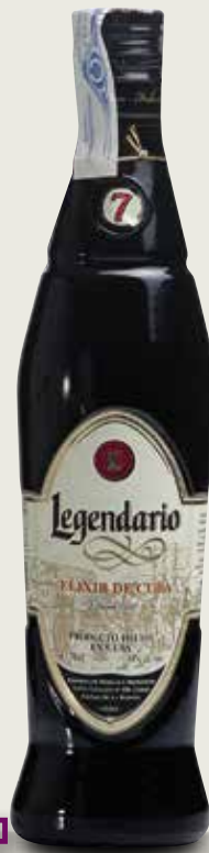
Rom Elixir 7 anys LEGENDARIO 70 Cl