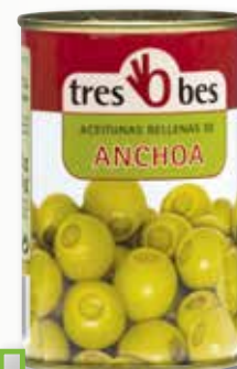
Oliva farcida d'anxova TRES BES 300 Gr