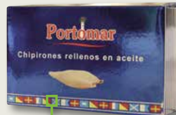
Xipirons en oli PORTOMAR OL-120