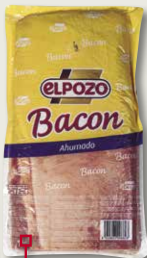
Bacó EL POZO el Kg