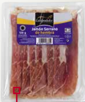
Pernil femella CAMDULCE 120 Gr