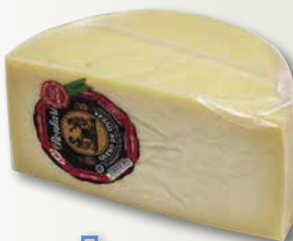
Formatge RONKARI 1/2 peça el Kg