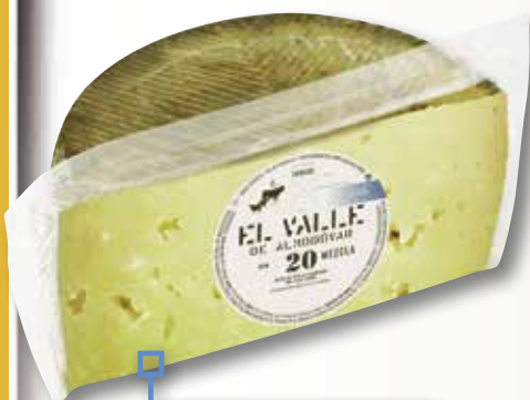
Formatge llet crua EL VALLE 20 PLATINIUM 1/2 peça el Kg