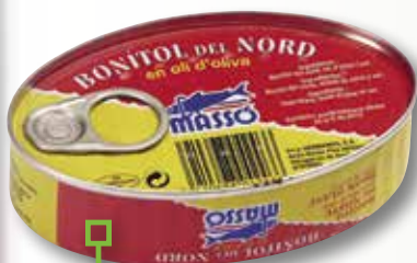
Bonítol en oli d'oliva MASSO 1/4