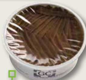
Anxova en oli GIL COMES tarrina 850 Gr