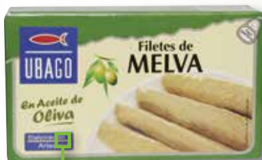
Melva en oli d'oliva UBAGO RR-125