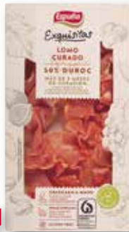
Llom curat Duroc ESPUÑA Exquisitas 80 Gr