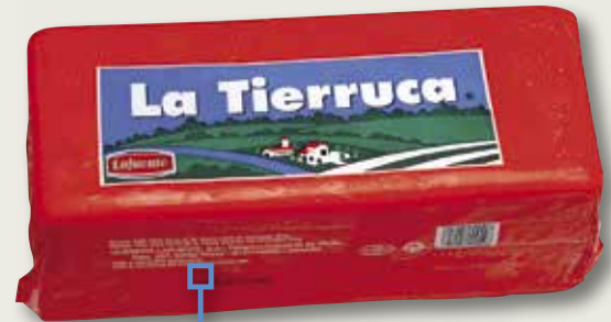
Formatge barra LA TIERRUCA el Kg