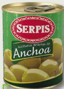
Oliva farcida mini bar SERPIS Tradicional pack 3 la unitat