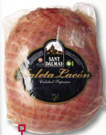
Espatlla de lacón SANT DALMAI el Kg