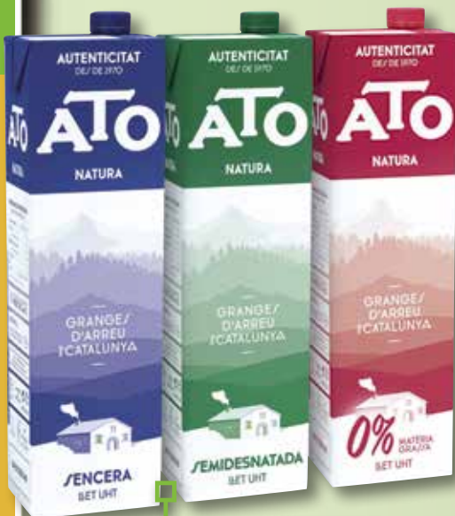
Llet desnatada, sencera o semidesnatada ATO brik 1 L