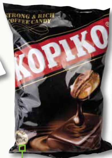
Caramel Original KOPIKO 800 Gr