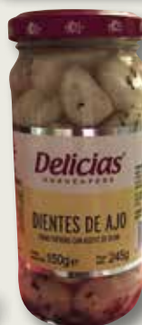
All fines herbes en oli d'oliva DELICIAS 250 MI