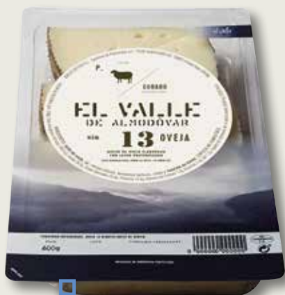
Formatge d'ovella curat EL VALLE 13 mini tascó 600 Gr