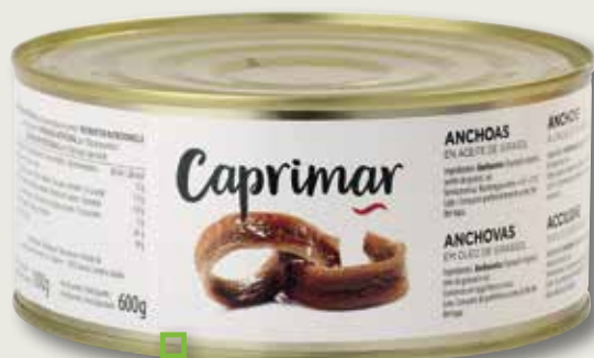
Anxova en oli vegetal CAPRIMAR RO-1000