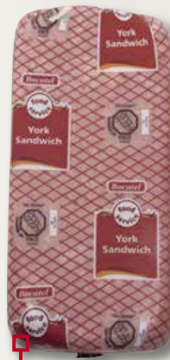
York sandvitx BOCATELL 11x11 el Kg