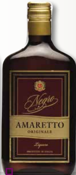
AMARETTO Negre 70 Cl