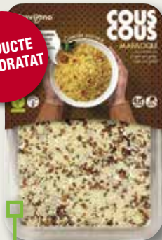
Cous cous marroquí TREVIJANO 300 Gr