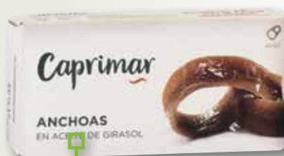
Anxova en oli vegetal CAPRIMAR RR-45