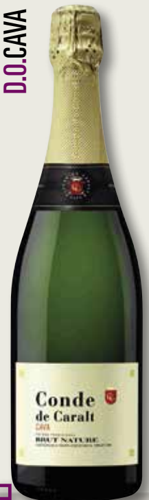
Cava brut nature CONDE CARALT