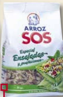
Arros amanida SOS 500 Gr