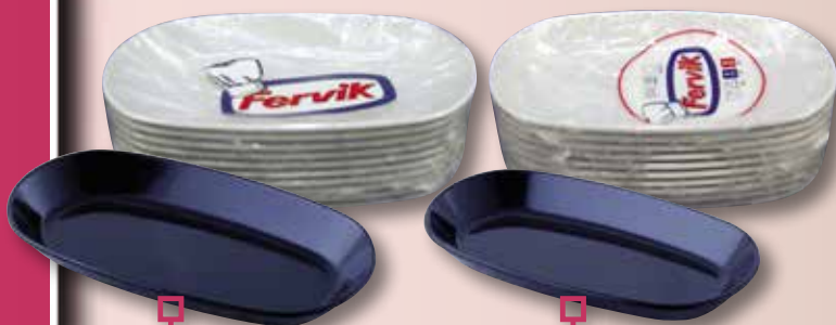
Rabanera blanca o negra FERVIK 15x8 RT-10