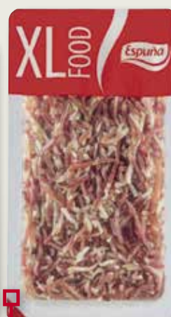
Fils de pernil curat B/G ESPUÑA 340 Gr