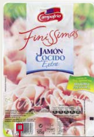
Pernil en llenques fines CAMPOFRIO 125 Gr