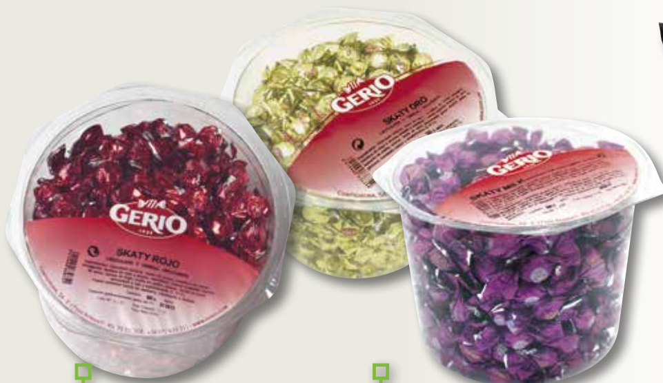
Caramel GERIO SKATY ROJO pot 350 unitats