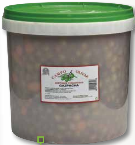
Oliva gaspatxa CAMPO OLIVAR 10 Kg