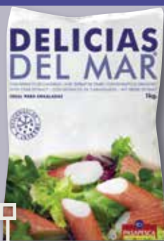
Delícies del mar bossa 1000 Gr