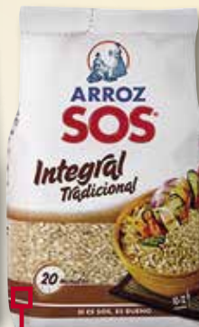
Arros integral SOS 1 Kg