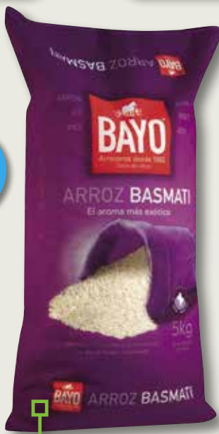
Arros basmati BAYO 5 Kg