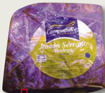
Pernil bodega CAMPODULCE mitja peça el Kg