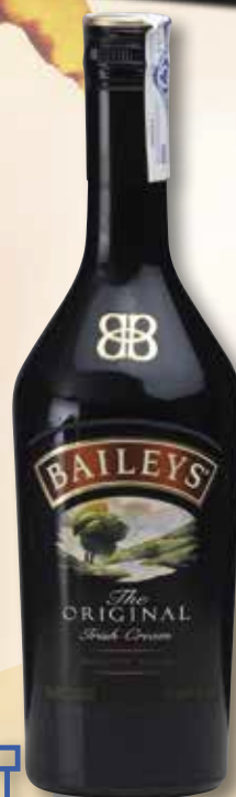
Irish Cream BAILEYS 70 Cl