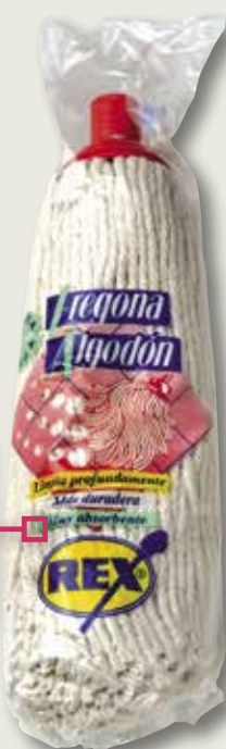
Motxo de cotó REX professional