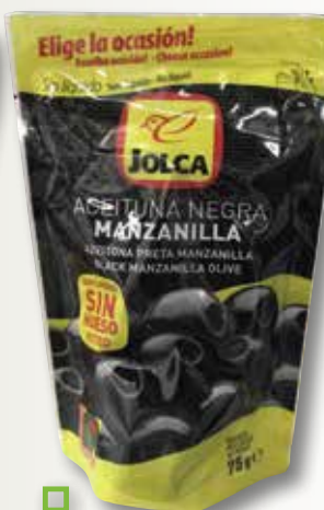
Oliva negra sense pinyol JOLCA bossa