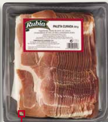
Espatlla curada RUBIA 500 Gr