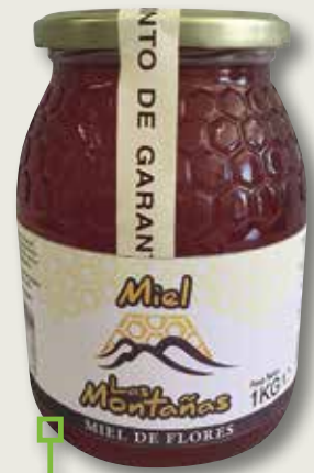
Mel milflors LAS MONTAÑAS 1 Kg