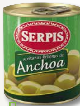
Oliva farcida d'anxova SERPIS 200 Gr