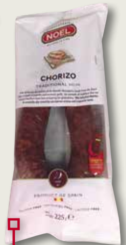
Xoriço sarta NOEL 225 Gr