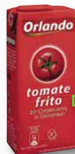
Tomàquet fregit ORLANDO brik 350 Gr