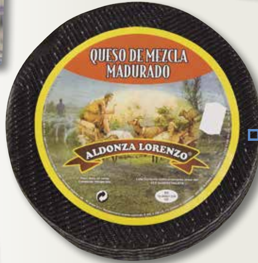
Formatge semicurat negre ALDONZA el Kg