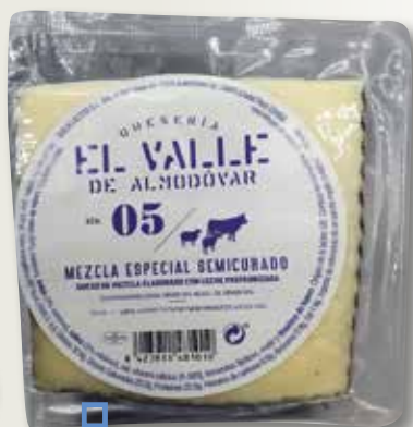
Formatge mescla semi EL VALLE 05 1/4 el Kg