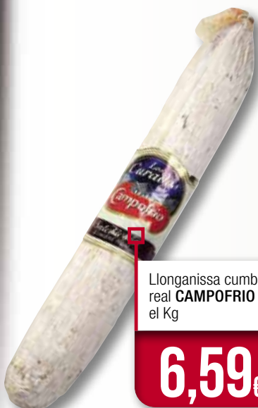
Llonganissa cumbre real CAMPOFRIO el Kg