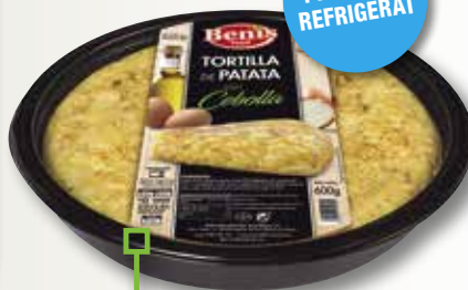
Truita de patata amb ceba BENI'S 1 Kg