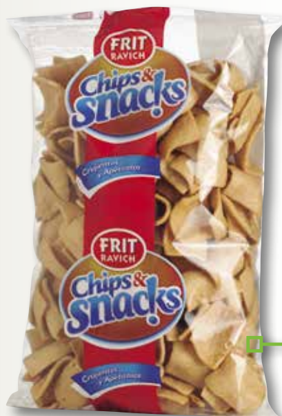
Bocafrit FRIT RAVICH 325 Gr