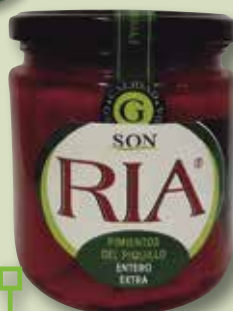
Pebrot piquillo sencer SON RIA B-370