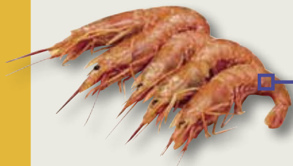
Gamba llagostinera 800 Gr