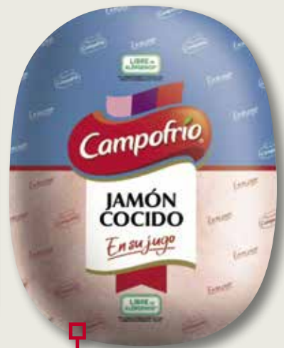
Pernil cuit al seu suc sense crosta CAMPOFRIO el Kg