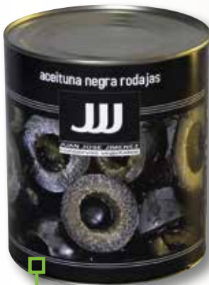
Rodanxes d'oliva negra JJJ 3 Kg