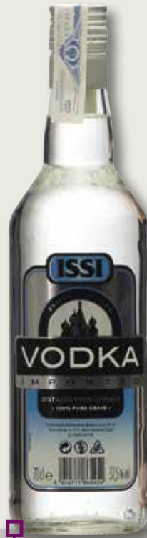
Vodka ISSI 70 Cl