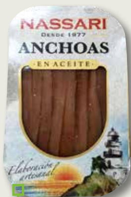
Anxova en oli NASSARI 30 Gr