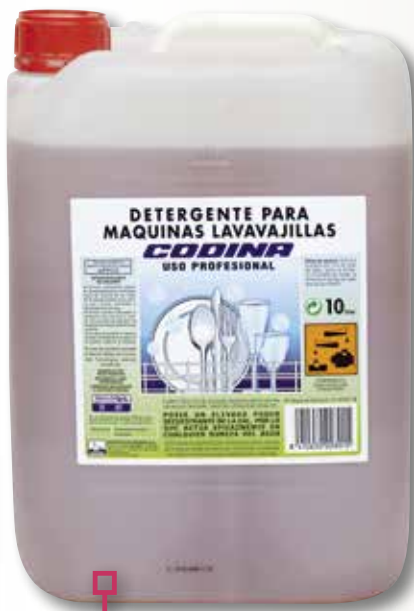
Rentavaixelles a màquina CODINA 10 L