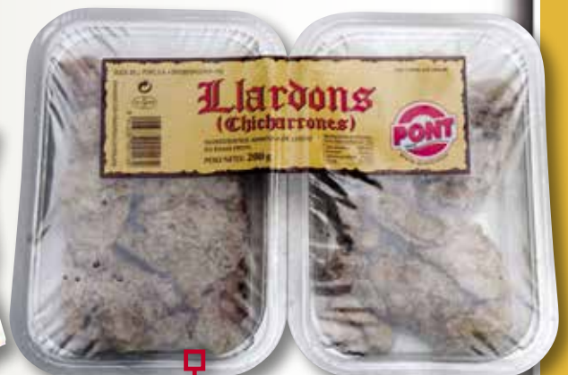
Lardons PONT 200 Gr