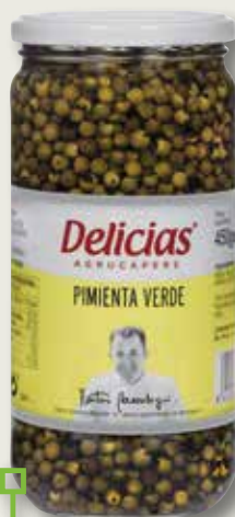
Pebre verd DELICIAS 720 Gr