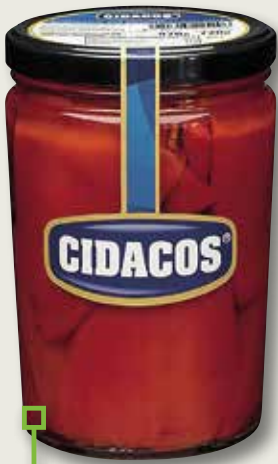
Pebrot de piquillo extra CIDACOS galó