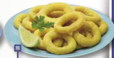
Anella romana "neutro" MAHESO 2 Kg