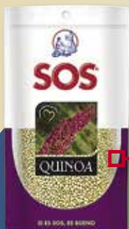
Quinoa SOS 250 Gr