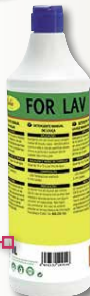
Rentavaixelles manual FORTEX 1 L