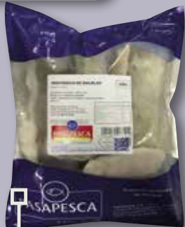
Ventresca de bacallà bossa 900 Gr