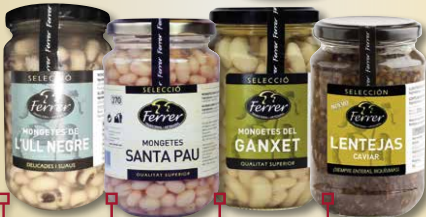
Mongetes Ull Negre FERRER 360 Gr