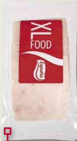
Gall d'indi cuit 11x11 ESPUÑA 340 Gr