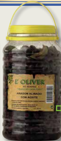
Oliva d'Aragó campero L'OLIVER 2,5 Kg