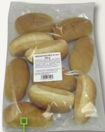
Mitges llunes 250 Gr 10 unitats