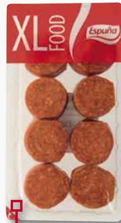
Pepperoni per pizza ESPUÑA 340 Gr