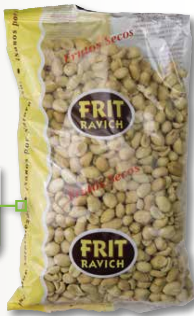
Cacauet repelat salat FRIT RAVICH 1 Kg