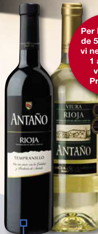
Vi negre collita ANTAÑO D.O. Rioja