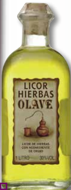
Licor d'herbes OLAVE flascó 1 L