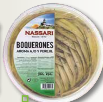
Seitò casolà NASSARI 250 Gr