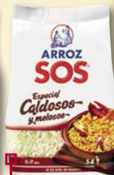
Arros SOS especial caldós 1 Kg