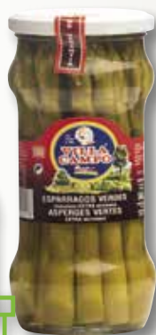
Espàrrecs de marge VILLACAMPO 1 Kg