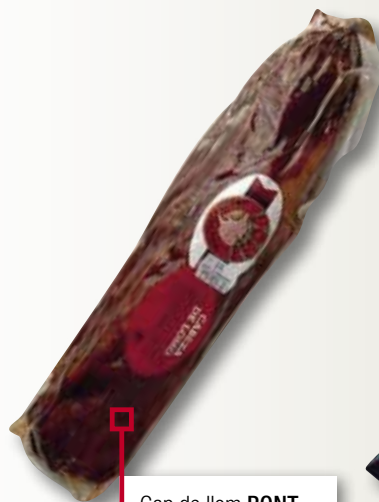
Cap de l'lom PONT el Kg