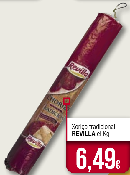
Xoriço tradicional REVILLA el Kg