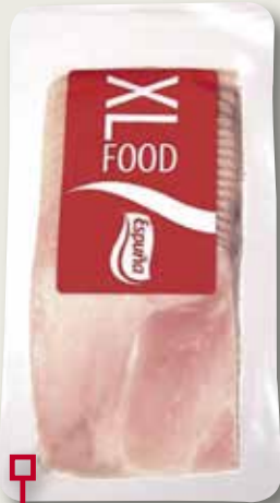
Pernil cuit 11x11 B/G ESPUÑA 340 Gr