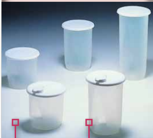
Pot hermètic FERVIK 1 L