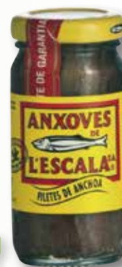
Anxova L'ESCALA vidre 100 Gr