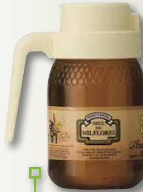
Mel milflors ANAE gerra 500 Gr