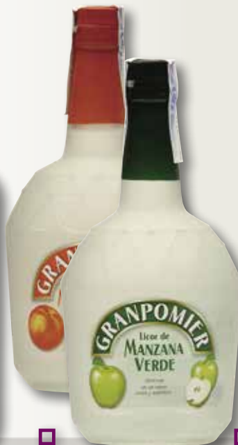
Licor de préssec GRANPECHER o poma GRANPOMIER 70 Cl