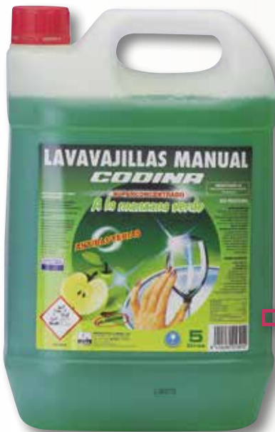
Rentavaixelles CODINA poma verda 5 L