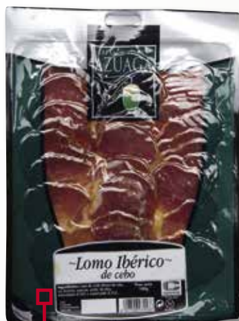
Llom ibèric AZUAGA 100 Gr