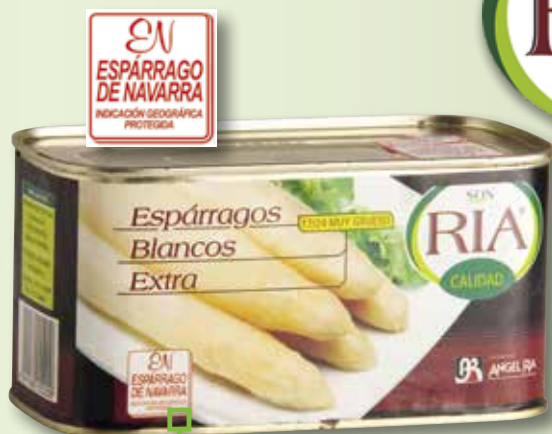
Espàrrecs blancs extra SON RIA 17-24 D.O. Navarra 1 Kg