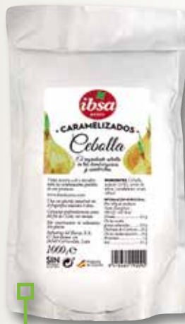
Ceba caramelitzada IBSA bossa 1 Kg