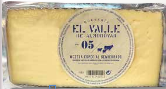
Formatge mescla semi EL VALLE 05 1/2 peça el Kg