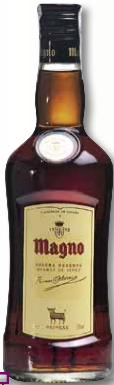
Brandy MAGNO 70 Cl