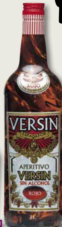
Aperitiu sense alcohol VERSIN