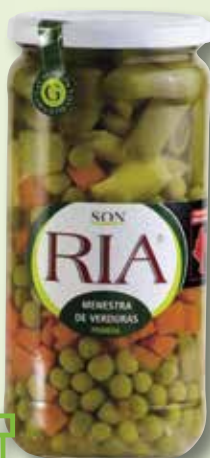
Menestra de verdures SON RIA V-720