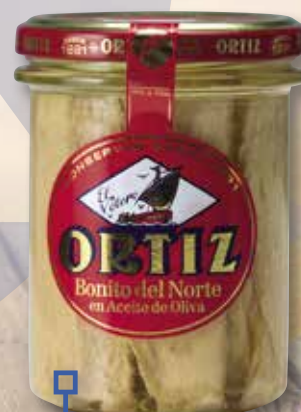
Bonítol en oli d'oliva ORTIZ vidre 220 Gr