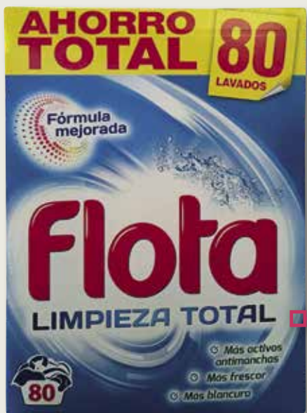
Detergent FLOTA Total 80 potets