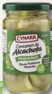
Carxofa CYNARA 10/12 314 MI