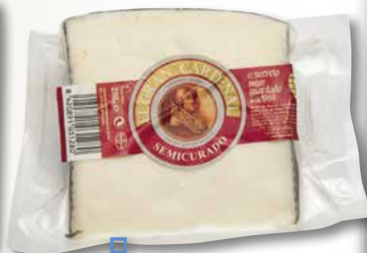
Formatge semicurat GRAN CARDENAL tascó 250 Gr