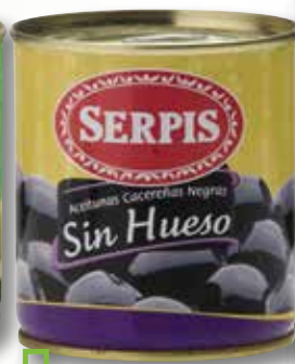
Oliva negra cacereña sense pinyol SERPIS 200 Gr