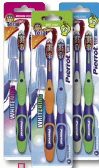
Raspall de dents PIERROT Gold mitjà, suau o dur P-2