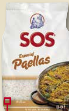
Arros SOS especial paella 1 Kg