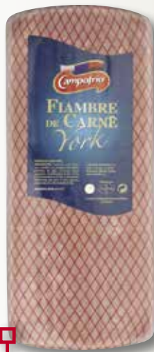
Fiambre CAMPOFRIO el Kg