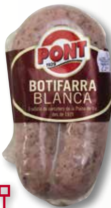
Botifarra blanca PONT 300 Gr