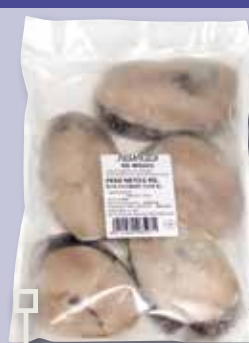
Rodanxes de lluç bossa 800 Gr