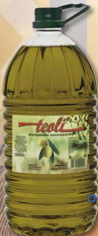
Oli de sansa d'oliva TEOLI 5 L