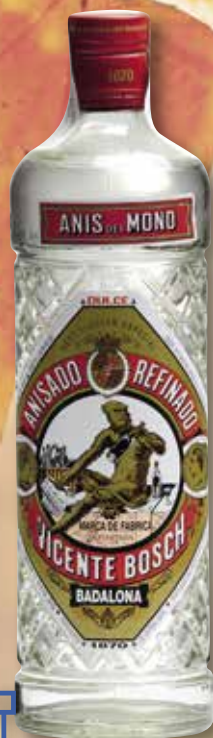
Anís DEL MONO dolç 70 Cl