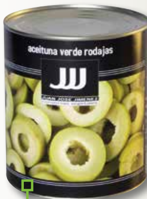
Rodanxes d'oliva verda JJJ 3 Kg