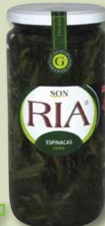
Espinacs SON RIA pot V-720