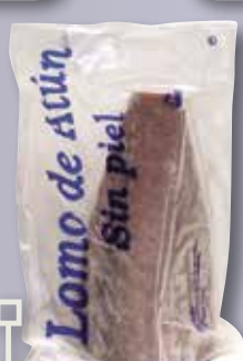
Llom de tonyina 3/4 kg al buit el Kg