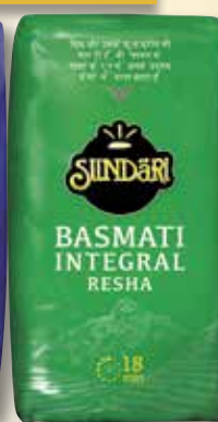
Arros basmati normal o integral SUNDARI 1 Kg