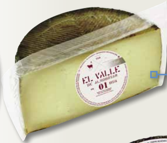
Formatge d'ovella Reserva Oro EL VALLE 01 1/2 peça el Kg