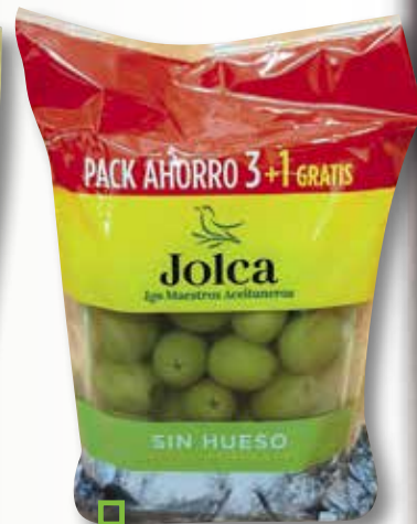
Olives manzanilla sense pinyol JOLCA pack