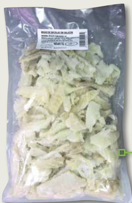
Motlles de bacallà UBAGO 1 Kg