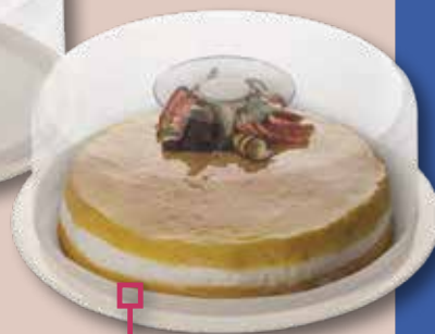
Tartera 30 FERVIK 34x13