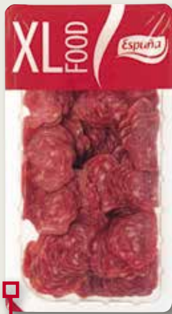
Llonganissa tradició ESPUÑA 340 Gr