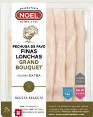
Pit de gall dindi llenques fines NOEL 100 Gr