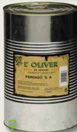
Oliva Perdigon L'OLIVER 2,5 Kg