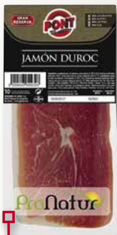
Pernil Duroc PONT 500 Gr