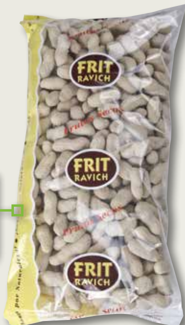
Cacauet amb closca FRIT RAVICH 1 Kg