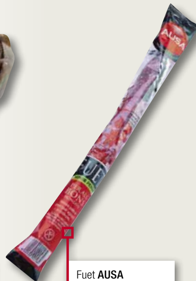
Fuet AUSA 140 Gr