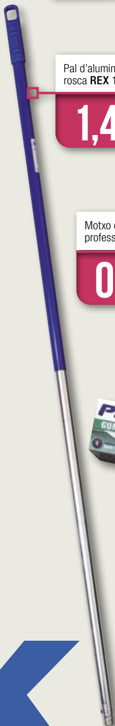
Pal d'alumini amb rosca REX 120 cm