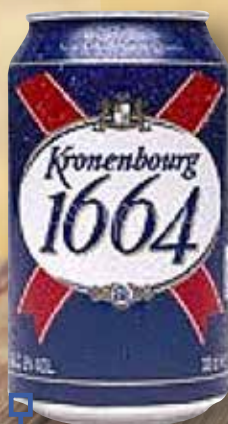
Cervesa KRONENBOURG llauna 33 Cl

Per la compra de 5 ampolles vi negre collita 1 ampolla vi blanc Promoció