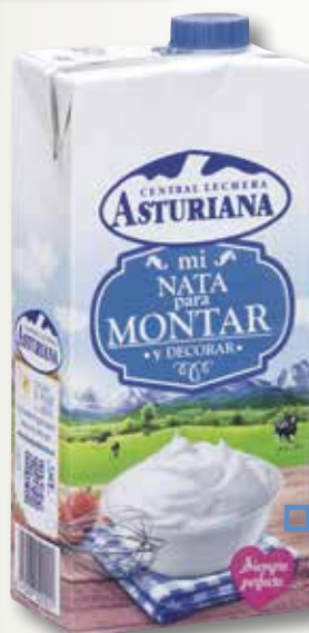
Nata per montar ASTURIANA 35,1% 1 L