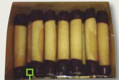
Cigarretes de cacau 180 Gr