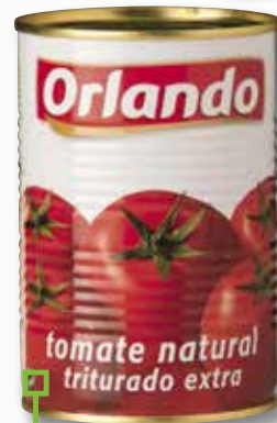
Tomàquet triturat ORLANDO 1/2 Kg