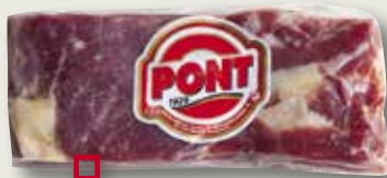
Cansalada curada PONT 400 Gr