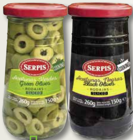
Rodanxes d'oliva verda o negra SERPIS 260 Gr