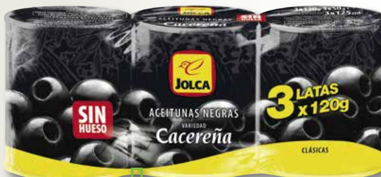
Oliva cacereña JOLCA minibar 120 Gr pack 3 unitat, la unitat