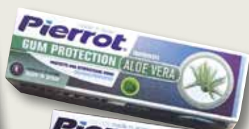
Dentífric PIERROT 75 ml Aloe Vera