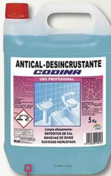
Desincrustant CODINA 5 L