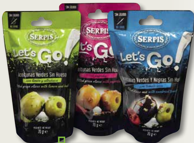
Oliva LETS GO! lilimona&albahaca, paprika o Mix verda&negra Kalama SERPIS