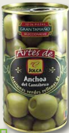
Oliva farcida d'anxova del Cantàbric JOLCA 350 Gr