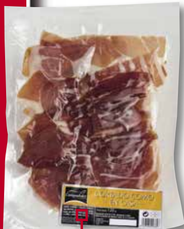
Pernil salat "com a casa" CAMPODULCE 120 Gr