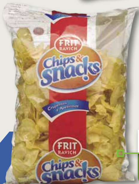
Xips FRIT RAVICH 500 Gr