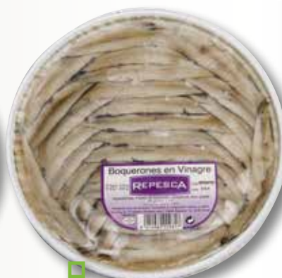
Seitò en vinagre REPESCA 500 Gr