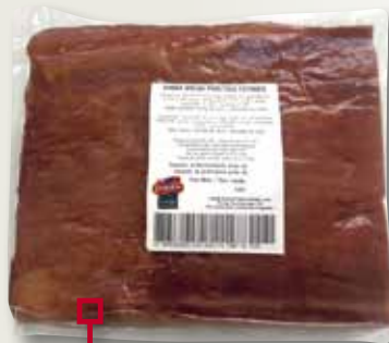
Bacó CAMPOFRIO meitat el Kg