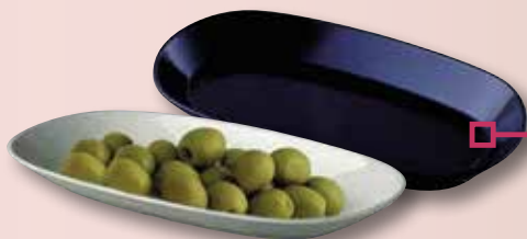
Rabanera blanca o negra FERVIK 17,5x10 RT-10