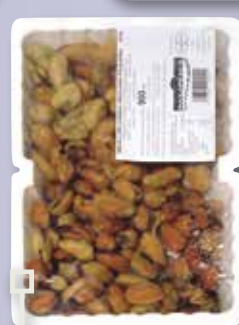
Musclos carn safata 900 Gr