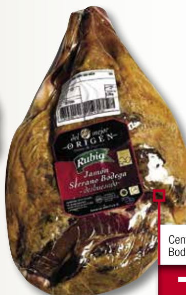
Centre de pernil serra Bodega RUBIA el Kg