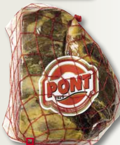
Centre de pernil serra PONT C/V 1/2 peça el Kg