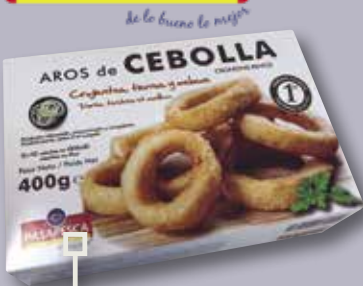
Anelles de ceba caixa 400 Gr