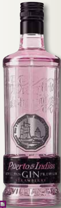
Gin maduixa PUERTO INDIAS 70 Cl