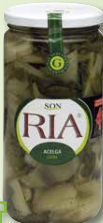
Bleda extra SON RIA pot V-720