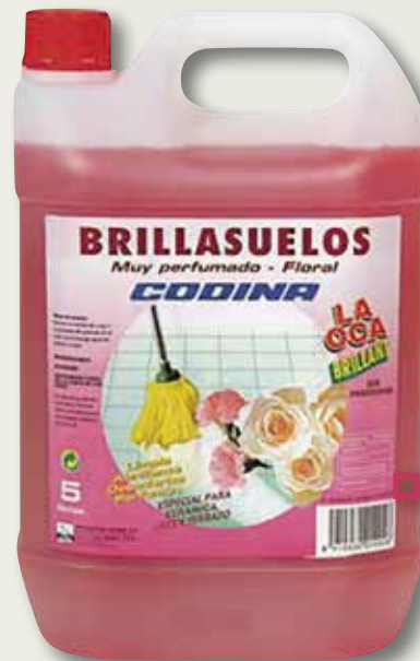
Brillaterres CODINA floral 5 L