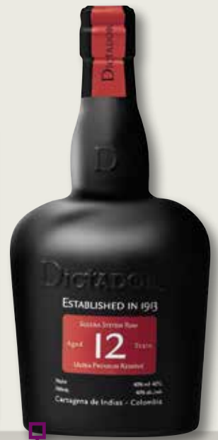
Rom DICTADOR 12 Anys 70 Cl