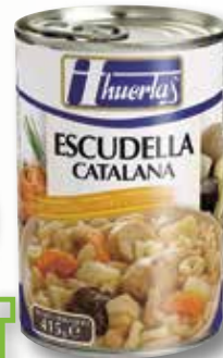
Escudella catalana HUERTAS 1/2 Kg