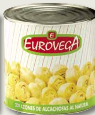
Carxofa EUROVEGA 30-40 3 Kg