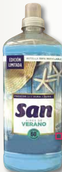
Suavitzant SAN estiu In&Out 1,44 L