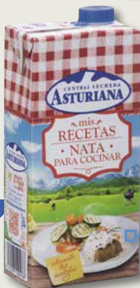
Nata per cuinar ASTURIANA 18% 1 L