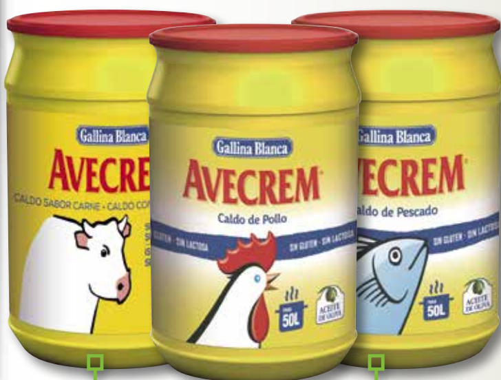
Brou de carn o pollastre AVECREM pot 1 Kg