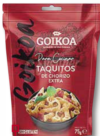
Tacs de xoriço GOIKOA 75 Gr