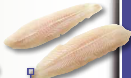
Filet de panga IQF 170/220 1 Kg