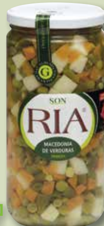
Macedònia de verdures SON RIA pot V-720