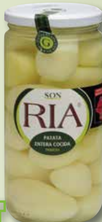
Patata sencera cuita SON RIA pot V-720