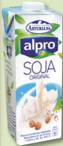
Beguda de soia Alprosoja ASTURIANA 1 L