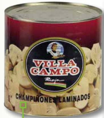
Xampinyons laminats VILLACAMPO 3 Kg