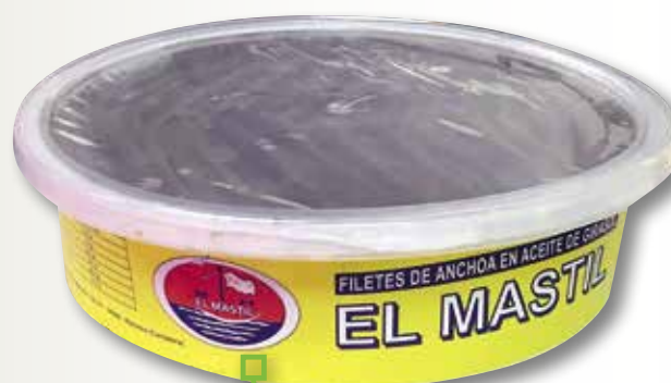
Anxova EL MASTIL 100 filets