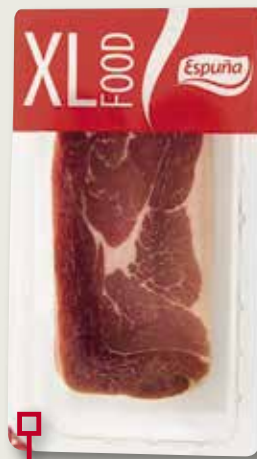
Pernil curat B/G ESPUÑA 340 Gr