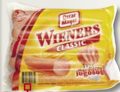
Frankfurt OSCAR MAYER Wiernes 5 unitats