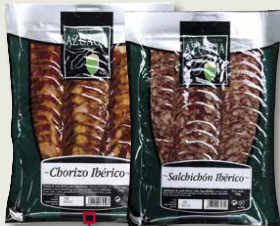
Llonganissa o xoriço ibèric AZUAGA 100 Gr