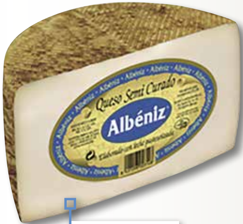
Formatge semicurat ALBENIZ 1/2 peça el Kg