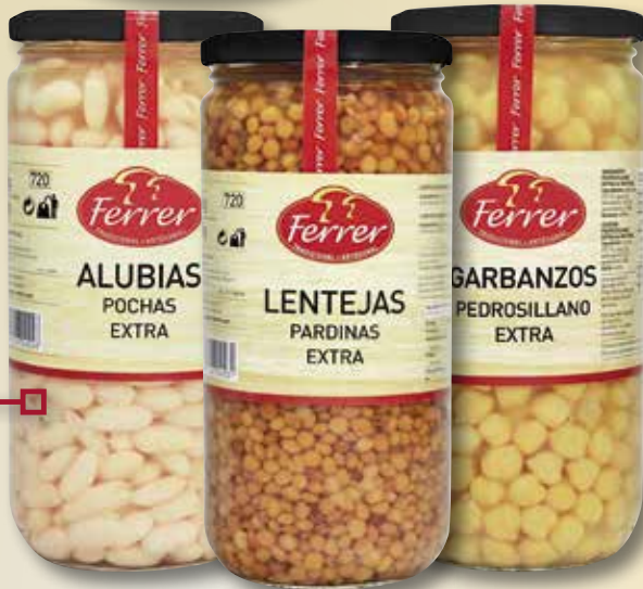
Mongeta Pocha, lletia pardina o cigrons Pedrosillano FERRER 660 Gr