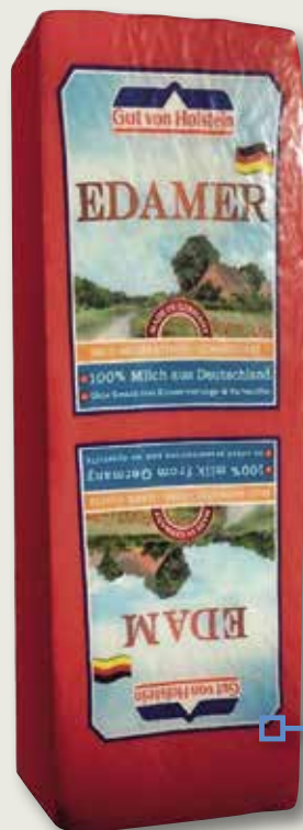
Formatge barra edam 40% NEUTRO el Kg