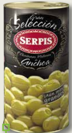
Oliva farcida Gran Selección SERPIS 160/200 2 Kg