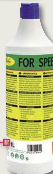
Anticalç FORTEX 1 L