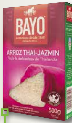
Arros Thai BAYO 1 Kg