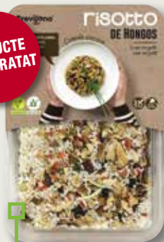
Risotto de fongs TREVIJANO 280 Gr