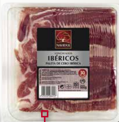
Espatlla ibèrica NAVIDUL 500 Gr