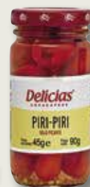
Piri piri sense cua DELICIAS 45 Gr