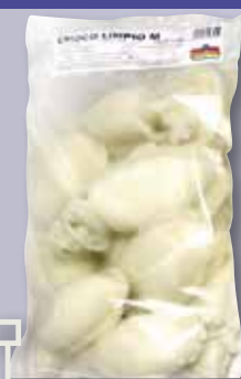
Xoco net 13/20 bossa 750 Gr