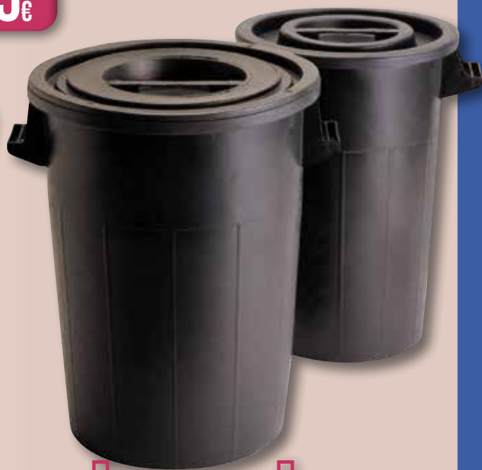
Cub d'escombraries sense tapa FERVIK 75 L