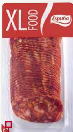
Xoriço ESPUÑA 340 Gr