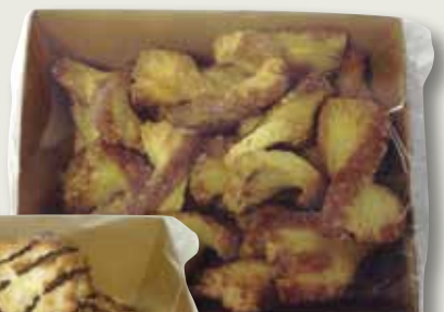
Coco xoca belga 200 Gr