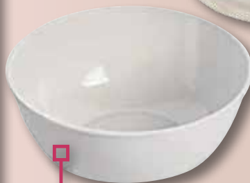
Bol blanc FERVIK 19x70