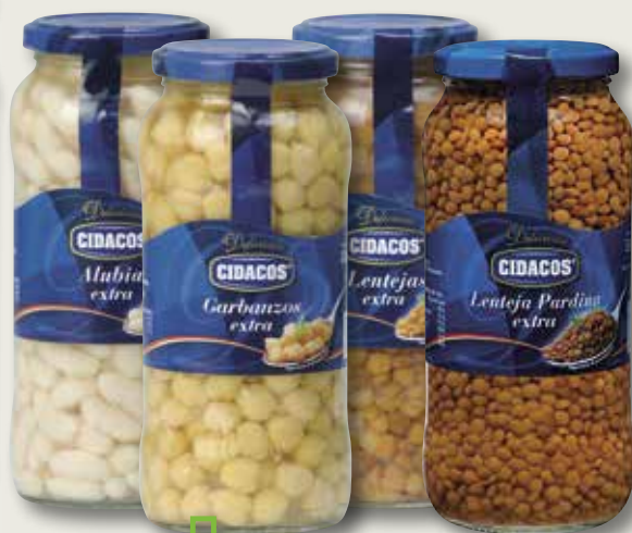
Mongeta, cigrons, llienties o llienties pardines CIDACOS 540 Gr