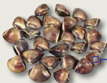
Cloïssa Viet Brown KING 40/60