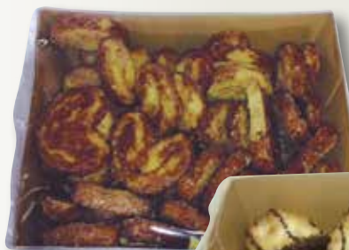
Mini palmeretes 175 Gr