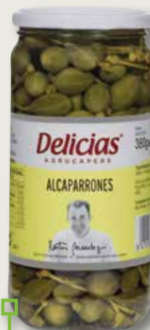
Tàperes grans DELICIAS 720 Gr