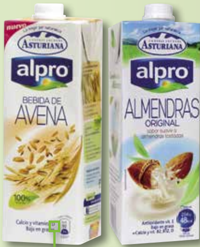
Beguda de civada o ametlla ALPRO 1 L