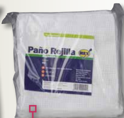
Drap de reixeta assortit REX 45x40