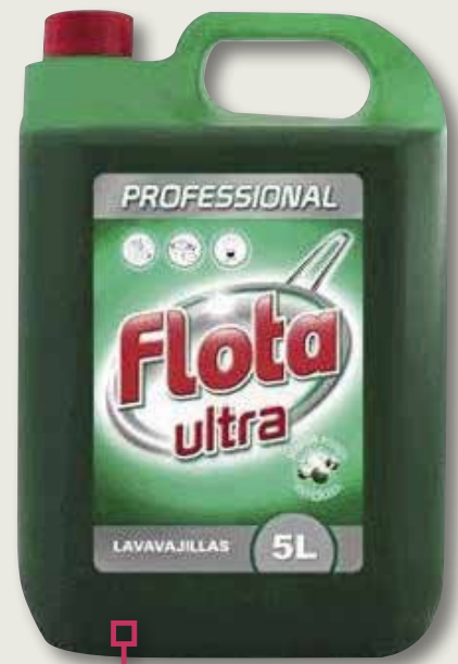
Rentavaixelles professional FLOTA 5 L