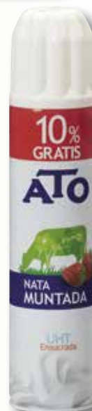
Nata ATO spray 250 MI