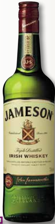
Whisky irlandès JAMESON 70 Cl