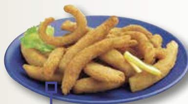
Raba natural MAHESO 1 Kg