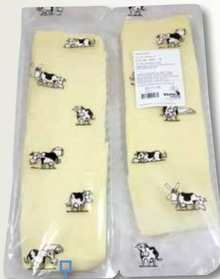
Edam en lloques 1 Kg