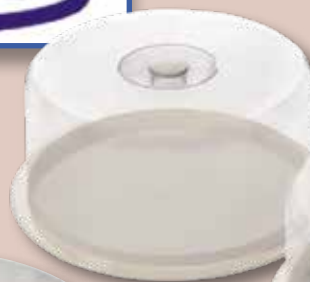
Tartera 24 FERVIK 28x10