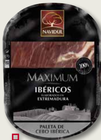
Centre d'espatlla de cebo motllo NAVIDUL el Kg