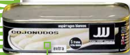
Espàrrecs blancs 5 fruits extra JJJ