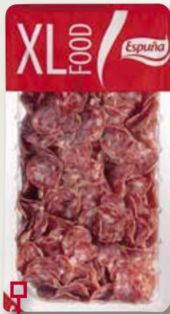
Fuet d'Olot ESPUÑA 340 Gr