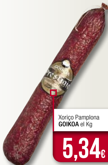
Xoriço Pamplona GOIKOA el Kg