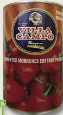
Pebrot morró 1ª VILLACAMPO 1/2 Kg