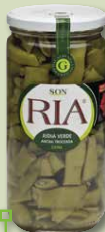
Mongeta verda ampla SON RIA V-720