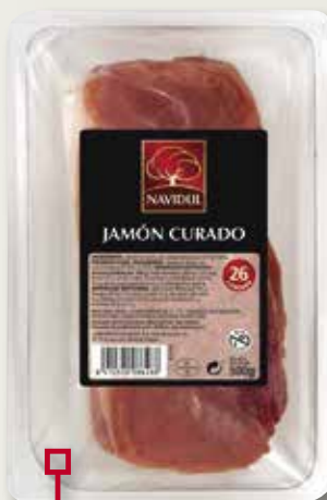
Pernil curat NAVIDUL 500 Gr