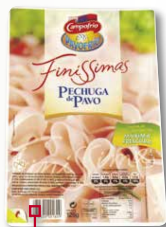
Pit de gall dindi en llenques fines CAMPOFRIO 125 Gr