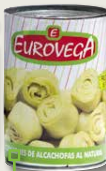
Carxofa EUROVEGA 8-10 1/2 Kg