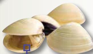
Cloïssa Viet White KING 40/60