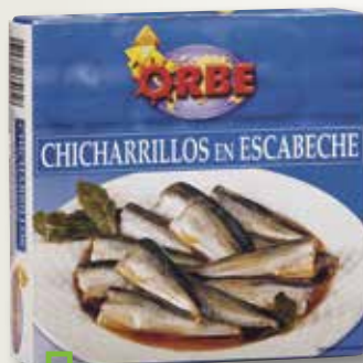
Chicharrillo en escabetx ORBE RO-280