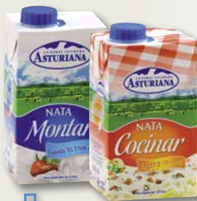
Nata per montar o cuinar ASTURIANA 50 Cl