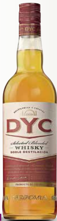
Whisky DYC 70 Cl