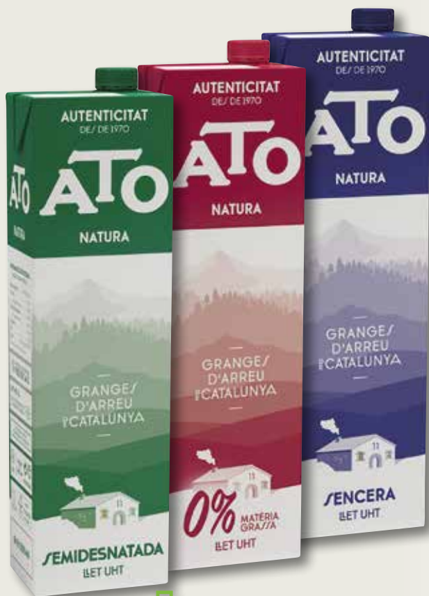
Llet semidesnatada, desnatada o sencera ATO brik 1 L