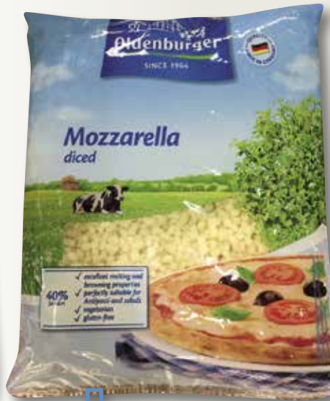
Formatge mozzarella a daus OLDENBURGUER 2 Kg