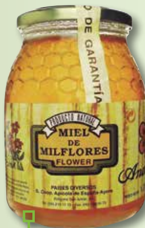
Mel milflors ANAE 1 Kg