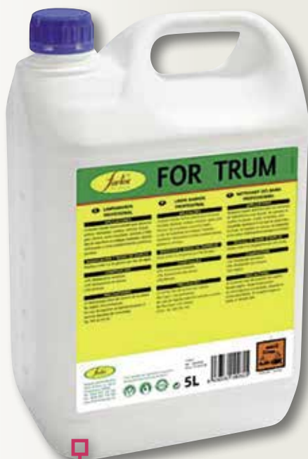
Desengreixant plancha/forn FORTEKX 5 L