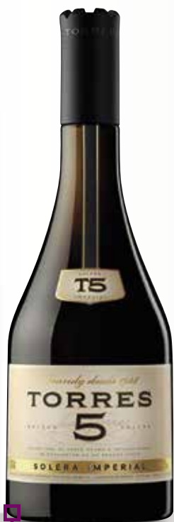
Brandy TORRES 5 anys 70 Cl