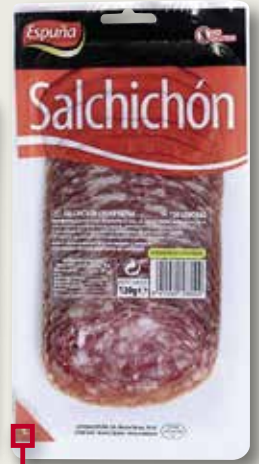
Llonganissa cular ESPUÑA 130 Gr