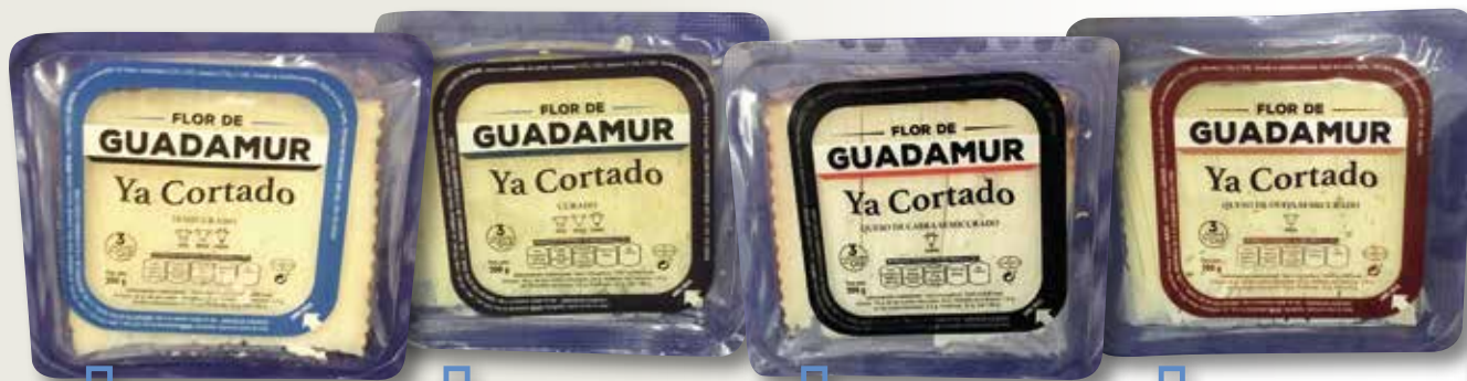
Formatge semi tallat FLOR GUADAMUR 200 Gr