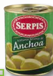
Oliva farcida mini bar SERPIS Tradicional pack 3 la unitat