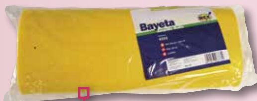
Rotllo groc REX 6 Mts