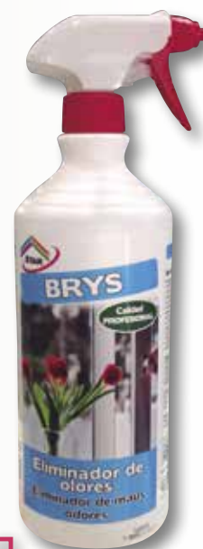
Eliminador d'olors BRY'S 1 L