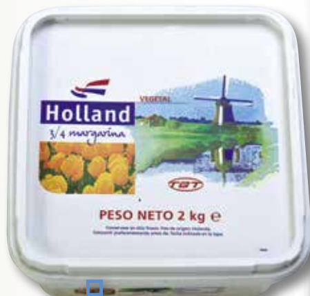
Margarina HOLLAND 2 Kg