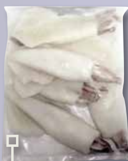
Calamar net 10/20 bossa 800 Gr