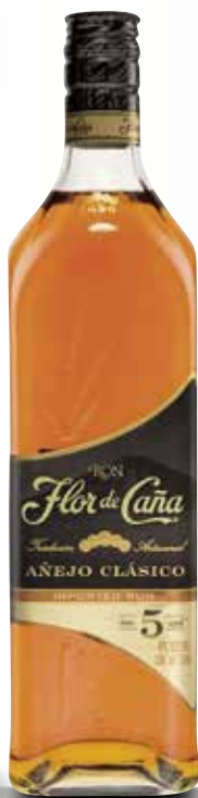
Rom FLOR DE CAÑA 5 anys 70 Cl