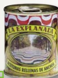
Oliva farcida EXPLANADA 160/200 170 Gr