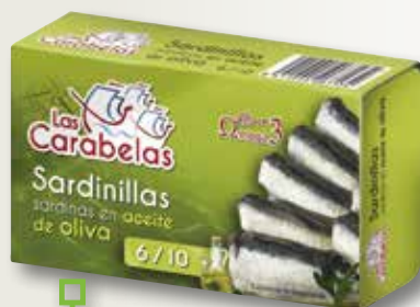
Sardineta en oli d'oliva LAS CARABELAS RR-90