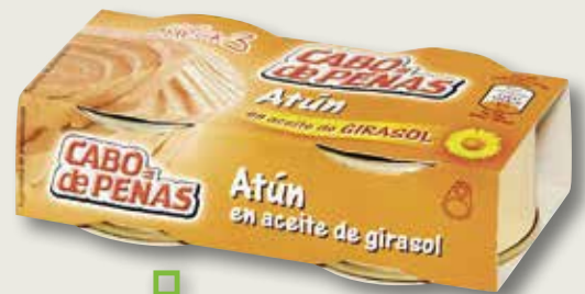
Tonyina en oli CABO DE PEÑAS RO-85 pack 2, la unitat