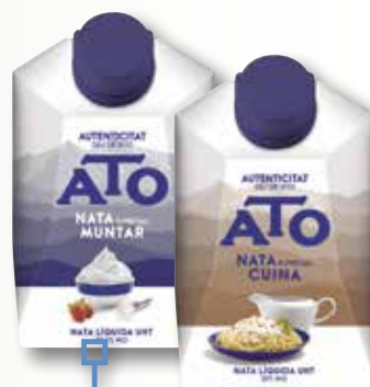
Nata per montar o cuinar ATO 200 ml