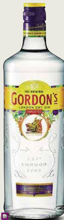
Gin GORDON'S 1 L