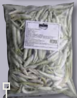
Pejerrey bossa 2,5 Kg