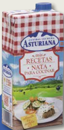
Nata per cuinar ASTURIANA 18% 1 L