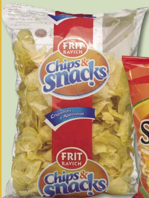
Xips FRIT RAVICH 500 Gr