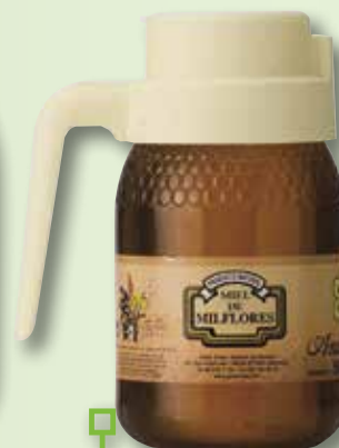
Mel milflors ANAE gerra 500 Gr