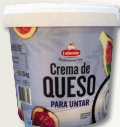
Formatge per untar CREMA 1,5 Kg