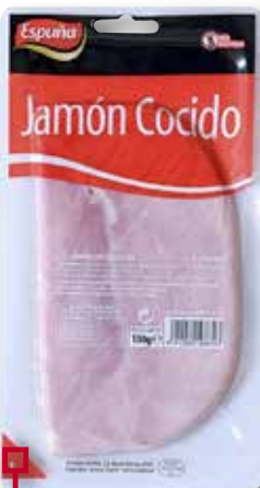
Pernil cuit ESPUÑA 130 Gr