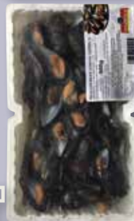
Musclos 1/2 closca safata 1 Kg