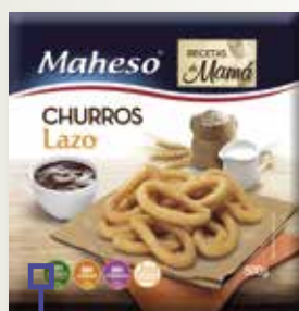
Xurro Ilaç MAHESO 500 Gr