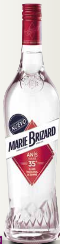
Anís MARIE BRIZARD 35° 70 Cl