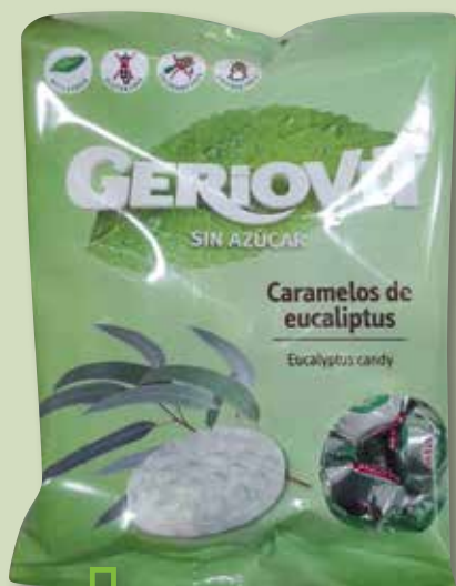
Caramel eucaliptus GERIOVIT 75 Gr