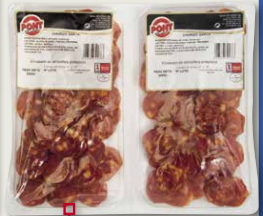
Xoriço sarta PONT 2x200 Gr