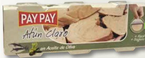
Tonyina clara en oli d'oliva PAY PAY RO-85 pack 3, la unitat