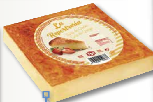
Pastis de formatge TIO RESTI 1600 Gr