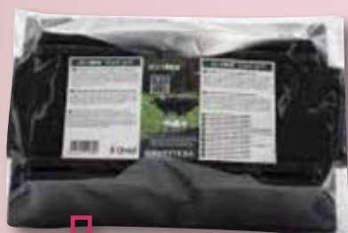
ABRATEX Black Grill