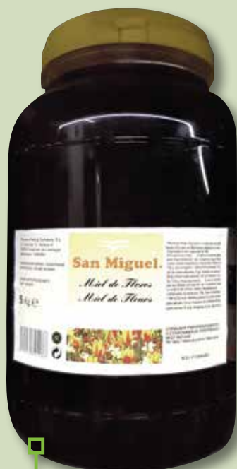
Mel SAN MIGUEL bidó 5 Kg