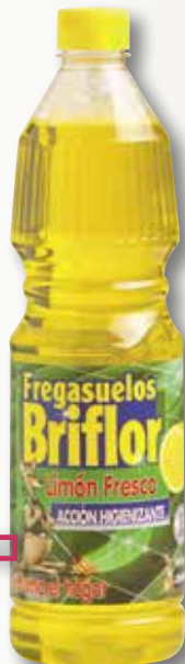
Netejaterres llimona BRIFLOR 1 L