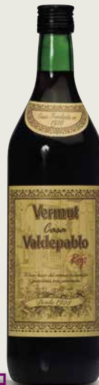
Vermut vermell VALDEPABLO 1 L