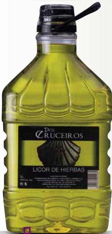
Licor d'herbes DOS CRUCEIROS garrafa 3 L