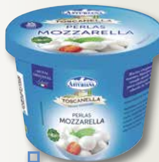
Mozzarella fresca TOSCANELLA perles 125 Gr