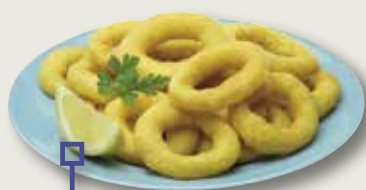
Anella romana "neutro" MAHESO 2 Kg