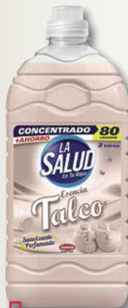
Suavitzant talc concentrat LA SALUD 2 L