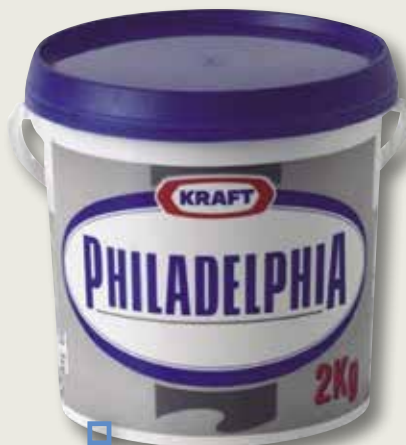
PHILADELPHIA cub 2 Kg