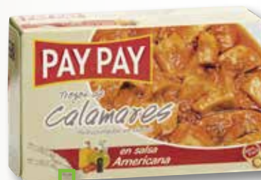
Calamars en salsa americana PAY PAY OL-120