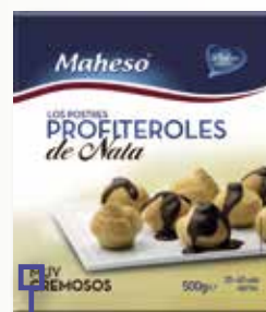
Profiterols amb nata MAHESO 500 Gr