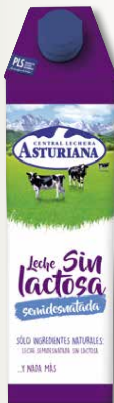
Llet sense lactosa amb calci ASTURIANA 1 L