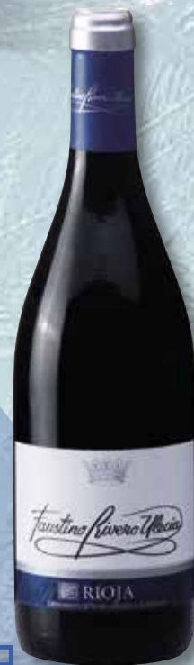
Vi negra collita FAUSTINO RIVERO D.O. Rioja