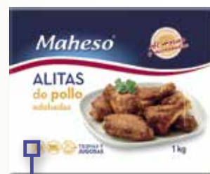
Aletes de pollastre MAHESO 1 Kg