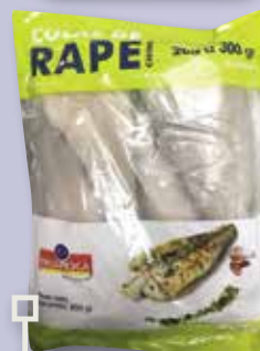
Cua de rap 200/300 bossa 800 Gr