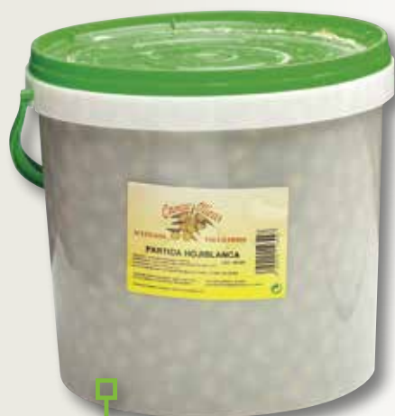
Oliva partida Jaén CAMPO OLIVAR 10 Kg