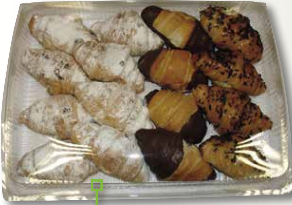
Pastisseria assortida DILLEPASA 550 Gr