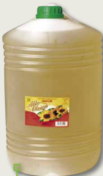
Oli Alto Oleico AMAFLOR 25 L