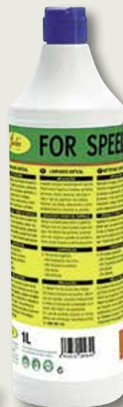
Anticalç FORTEKX 1 L