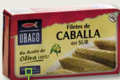
Verat del sud en oli d'oliva UBAGO RR-125