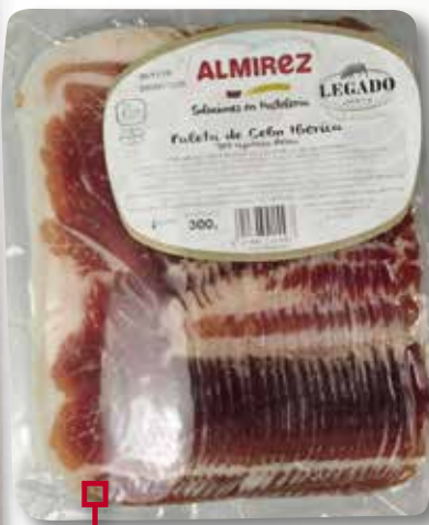
Espatlla ibèrica ALMIREZ 300 Gr