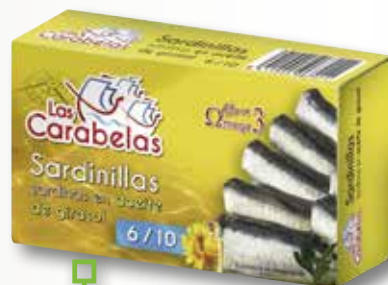
Sardineta en oli vegetal LAS CARABELAS RR-90