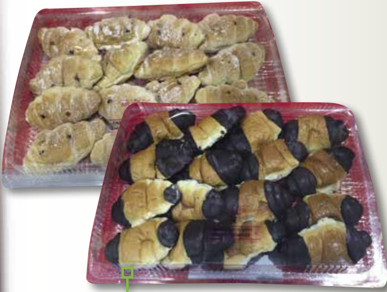
Croissant farcit o banyat MUSFI 16 unitats