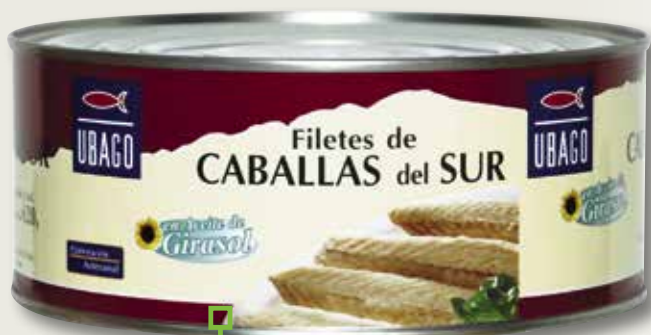
Verat del sud UBAGO RO-1000