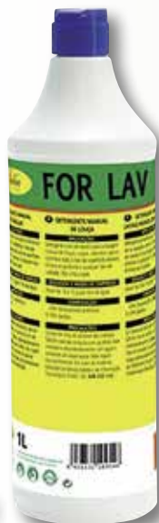
Rentavaixelles manual FORTEKX 1 L