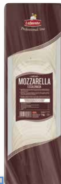
Mozzarella LAFUENTE llenques 1 Kg