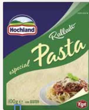
Formatge ratllat especial pasta HOCHLAND 100 Gr