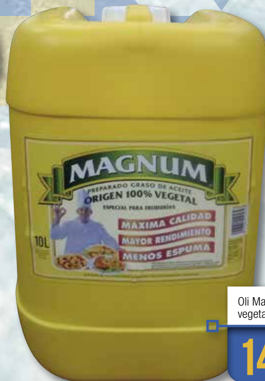
Oli Magnum 100% vegetal MILLAS 10 L