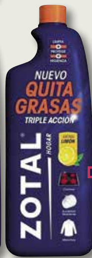
Quitagrasa llimona ZOTAL pistola o recanvi 750 MI