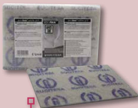
ABRATEX White Grit delicat