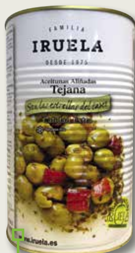
Oliva texana IRUELA llauna 5 Kg