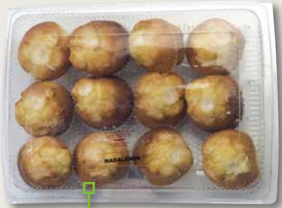
Madalenón DILLEPASA 12 unitats