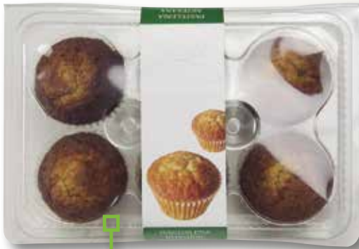
Magdalenes integrals DILLEPASA 6 unitats