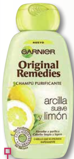
Xampú argila ORIGINAL REMEDIES