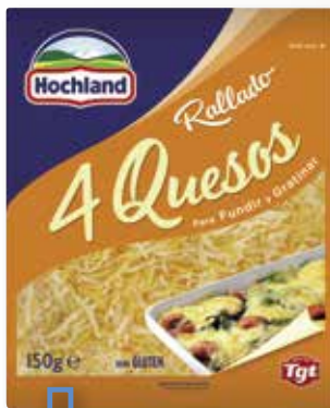
Formatge ratllat 4 formatges HOCHLAND 150 Gr