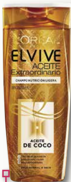
Xampú ELVIVE oli coco 300 MI