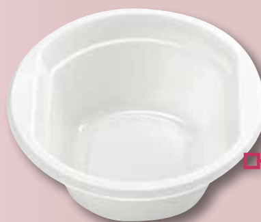
Maxi bol aperitiu 250 CC RT-12