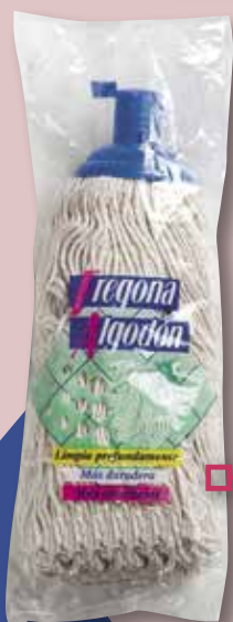
Motxo de cotó