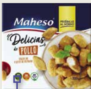
Delicias de pollastre MAHESO 300 Gr