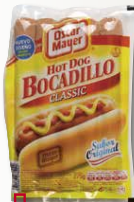
Frankfurt OSCAR MAYER Bocadillo 5 unitats