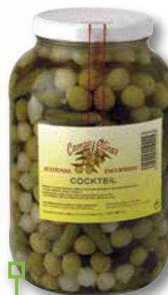
Cocktail CAMPO OLIVAR galó