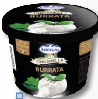
Formatge burrata TOSCANELLA 150 Gr