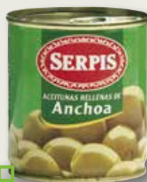
Oliva farcida d'anxova SERPIS 200 Gr