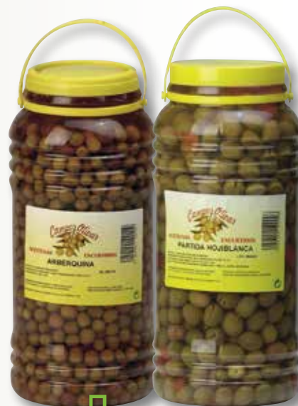
Oliva arberquina o partida Jaén CAMPO OLIVAR 3 Kg