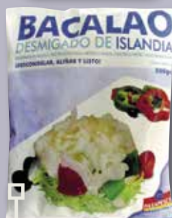
Bacallà esqueixat bossa 500 Gr