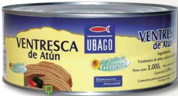
Ventresca de tonyina UBAGO RO-1000