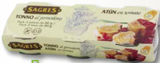
Tonyina amb tomàquet SAGRES RO-80 pack 3, la unitat