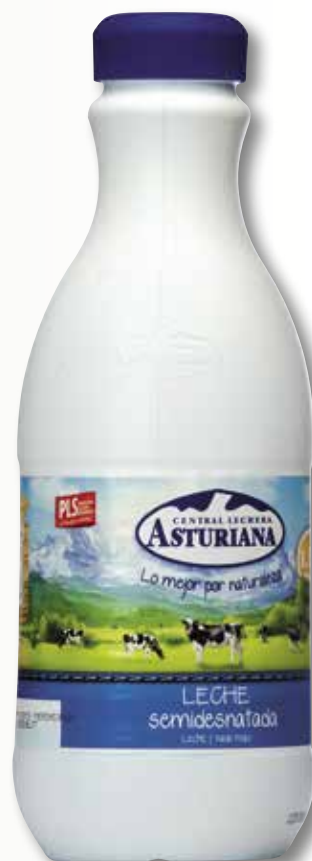
Llet semidesnatada ASTURIANA 1,5 L