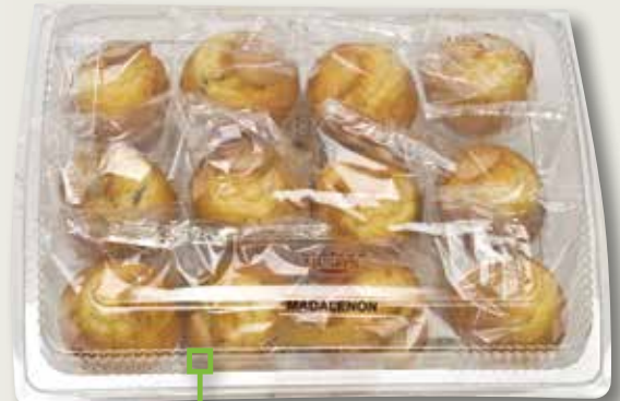
Madalenón MUSFIS individual