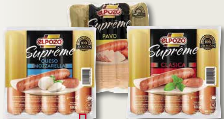
Sasitxes EL POZO King gall dindi, mozzarella o original 330 Gr