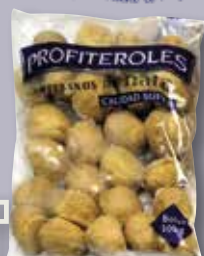
Profiterols de nata bossa 500 Gr