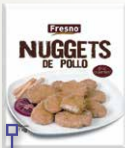
Nuggets FRESNO 1 Kg