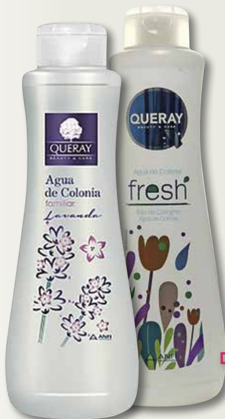
Colònia familiar lavanda o fresca QUERAY 750 MI