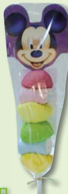
Brochette Disney GERIO