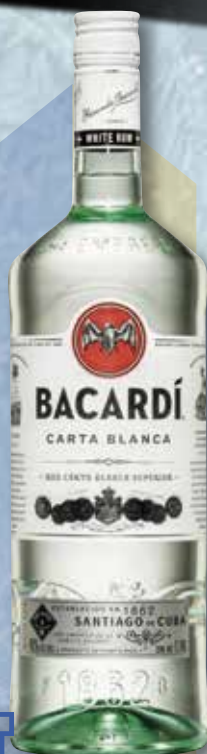
Rom BACARDI 1 L