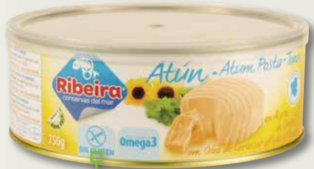
Tonyina RIBEIRA RO-750