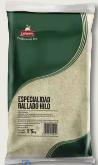
Formatge ratllat per gratinar HORECA 1'5 Kg