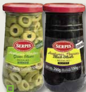
Rodanxes d'oliva verda o negra SERPIS 260 Gr