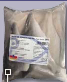
Filet d'orada bossa 800 Gr