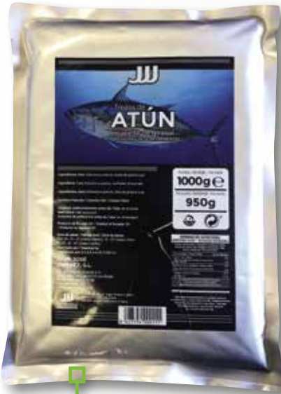
Tonyina JJJ bossa 1 Kg