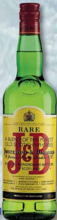
Whisky escocès J.B. 1 L