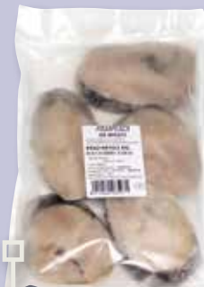
Rodanxes de lluç bossa 840 Gr