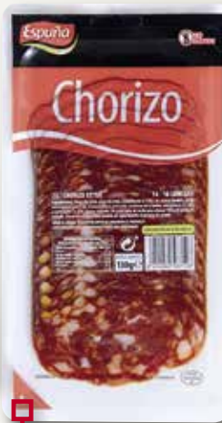
Xoriço ESPUÑA 130 Gr