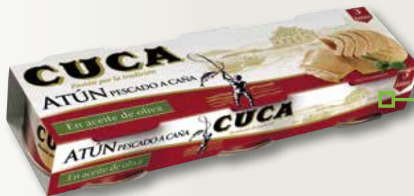
Tonyina en oli d'oliva CUCA RO-70 pack 3, la unitat