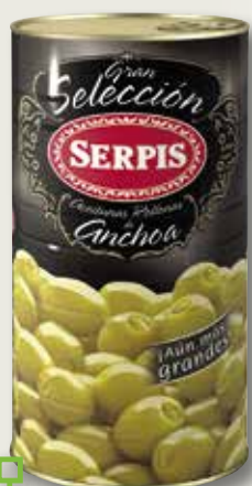
Oliva farcida Gran Selección SERPIS 160/200 2 Kg