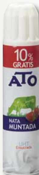
Nata ATO spray 250 ml