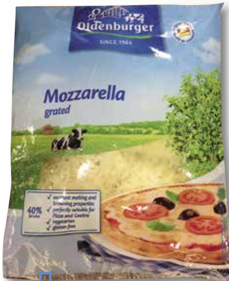
Formatge mozzarella ratllat OLDENBURGUER 2 Kg