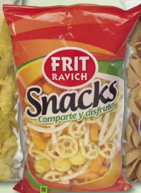
Còctel snacks FRIT RAVICH 120 Gr