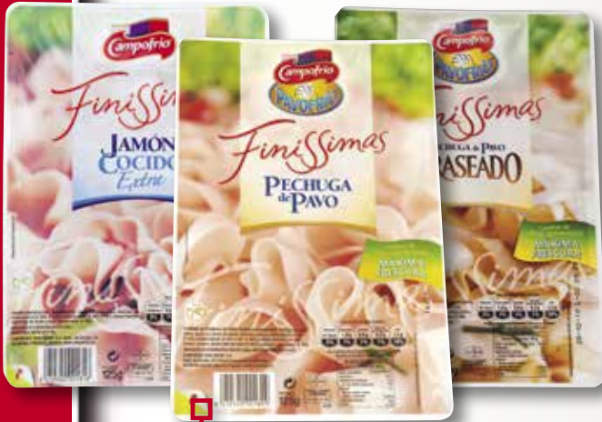
Pernil, pit de gall dindi o brasejat en llenques fines CAMPOFRIO 125 Gr