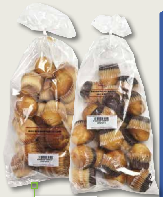
Mini magdalenes normal o màrmol DILLEPASA 350 Gr