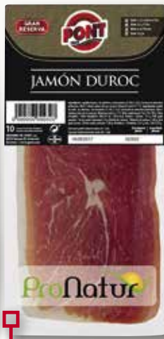
Pernil Duroc PONT 500 Gr