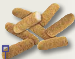
Varetes de pollastre MAHESO 1 Kg