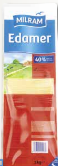
Formatge Edam en llenques MILRAM 1 Kg