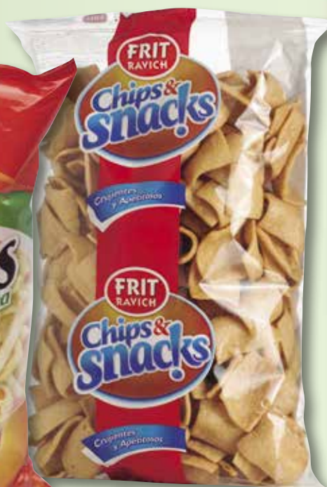
Bocafrit FRIT RAVICH 325 Gr