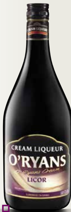
O'RYANS IRISH CREAM 1 L