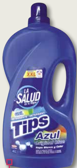
Detergent líquid blau LA SALUD 4 L