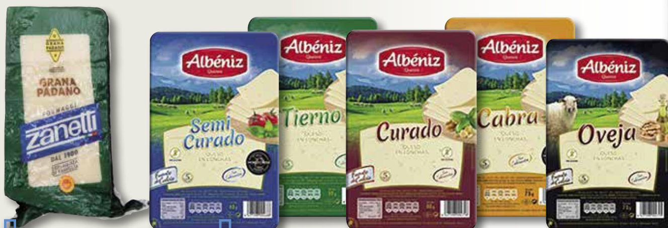
Formatge cunya GRANA PADANO el Kg