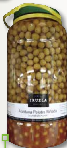
Pelotón amanit IRUELA galó pet