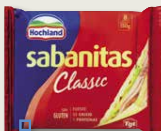
Sabanitas HOCHLAND 150 Gr 8 unitats