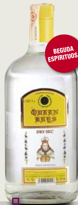
QUEEN KRYS 1 L