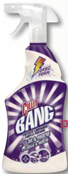
CILLIT BANG lleixiu pistola 750 MI