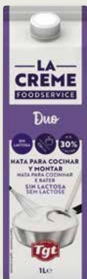
Nata 30% OLDENBURGER brik 1 L