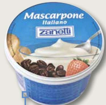
Mascarpone ZANETTI 500 Gr