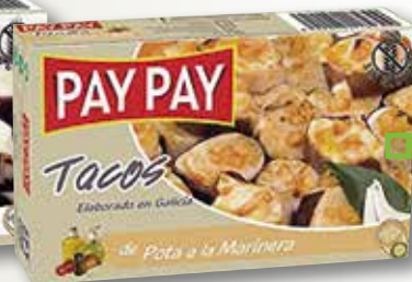
Tac de pota en oli, allada o marinera PAY PAY OL-120