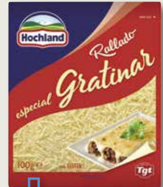
Formatge ratllat per gratinar HOCHLAND 100 Gr