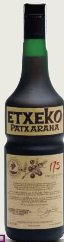
ETXEKO PATXARANA NAVARRA 1 L