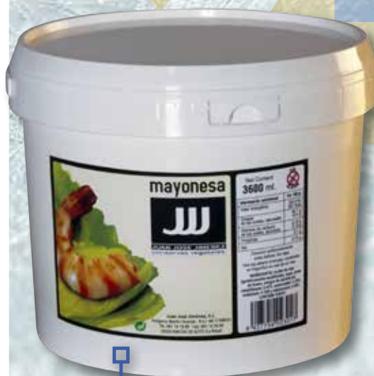
Maionesa JJJ cub 3.600 MI