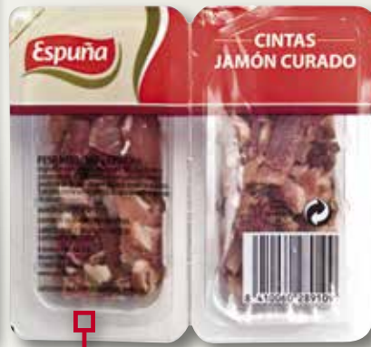
Cintas de pernil curat ESPUÑA 100 Gr