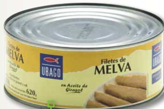
Melva almadraba en oli de girasol UBAGO RO-1000