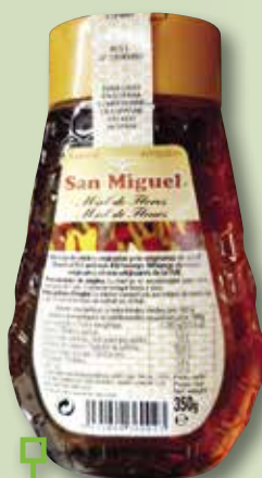
Mel SAN MIGUEL antigoteig 350 Gr