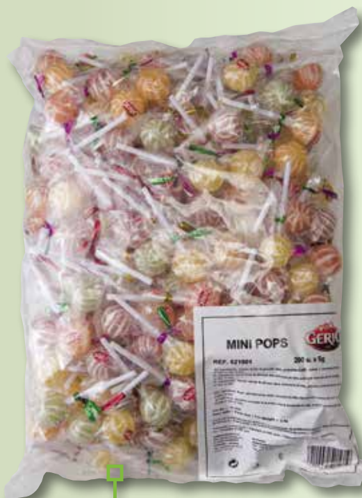
Mini pop surtido GERIO 1 Kg