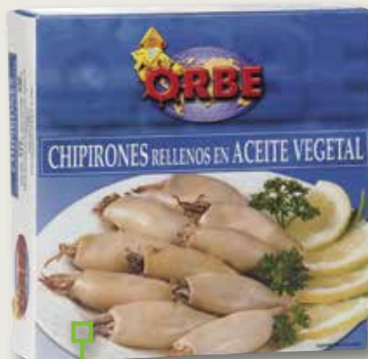
Xipirons farcits ORBE RO-550